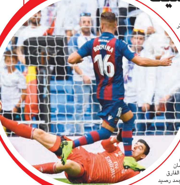
بكرة سدها من داخل المنطقة في سقف المرعى اثر تمريرة متقنة من بيل (82) منها عمقا تديفيا لفريقه استمر 481 دقيقة.

تلقى ريال مدريد بطل أوروبا في المواسم الثلاثة الماضية، خسارة ثالثة في الدوري الإسباني لكرة القدم هذا الموسم، بسقوطه أمام ضيفه ليفانتي 2-1 أمس في المرحلة التاسعة. وسجل إصابتي الفائز خوسيه لويس موراليس (7) وروجيه مارتى من ركلة جزاء (13)، قبل أن يقلص البرازيلي مارسيلو الفارق في الدقيقة 72.