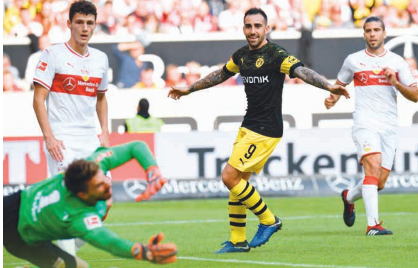
مهاجم دورتموند الكاسير يواصل تألقه ويسجل هدف فريقه الثالث