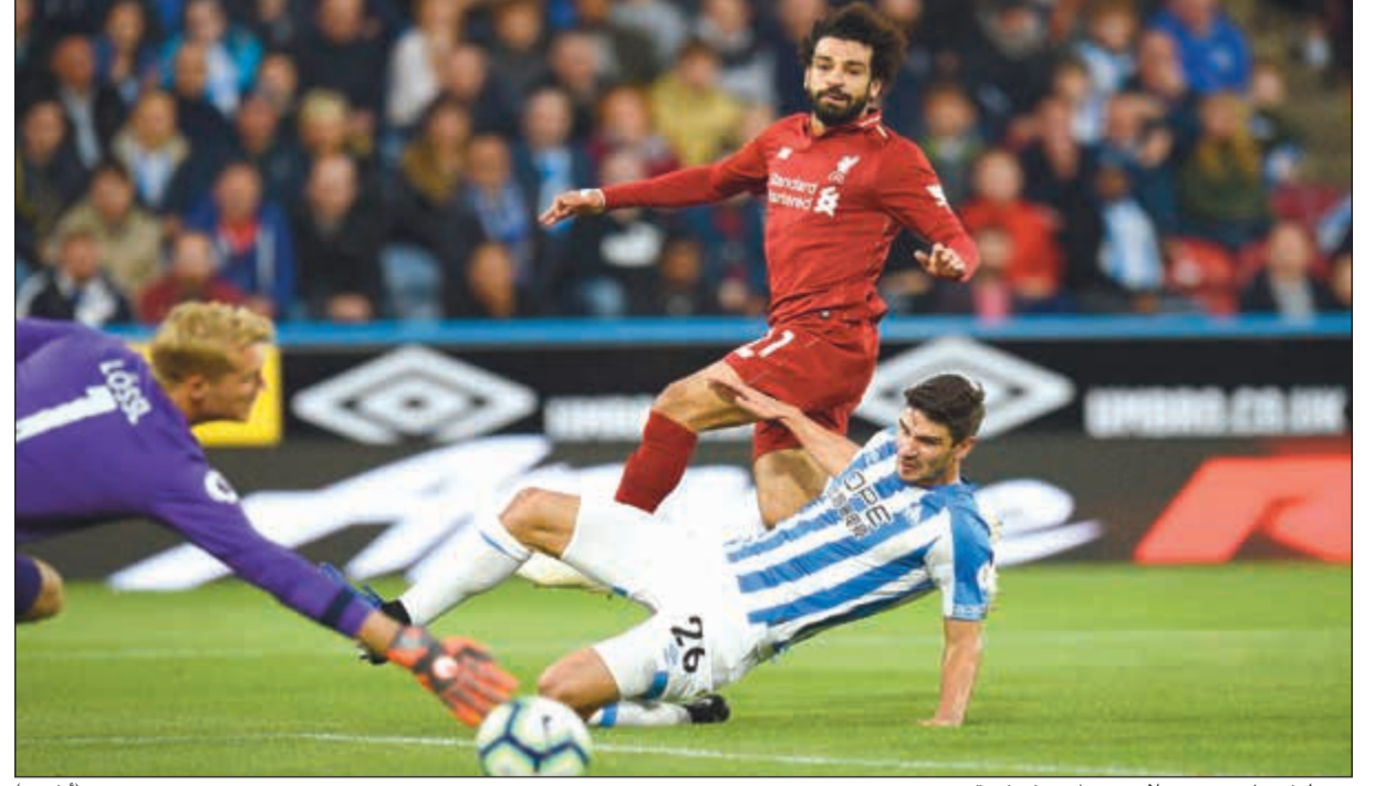
نجم ليفربول محمد صلاح يسجل هدف فريقه

المركز الخامس عشر. وفي باقي المباريات فاز برابتون على مضيفه نيوكاسل 1-0، كما تغلب كارديف سيتي على ضيفه فولهام 2-4، وواتفورد على مضيفه وولفرهامبتون 0-2، وتعادل بورنموث مع ساوثهامبتون سلبيا.