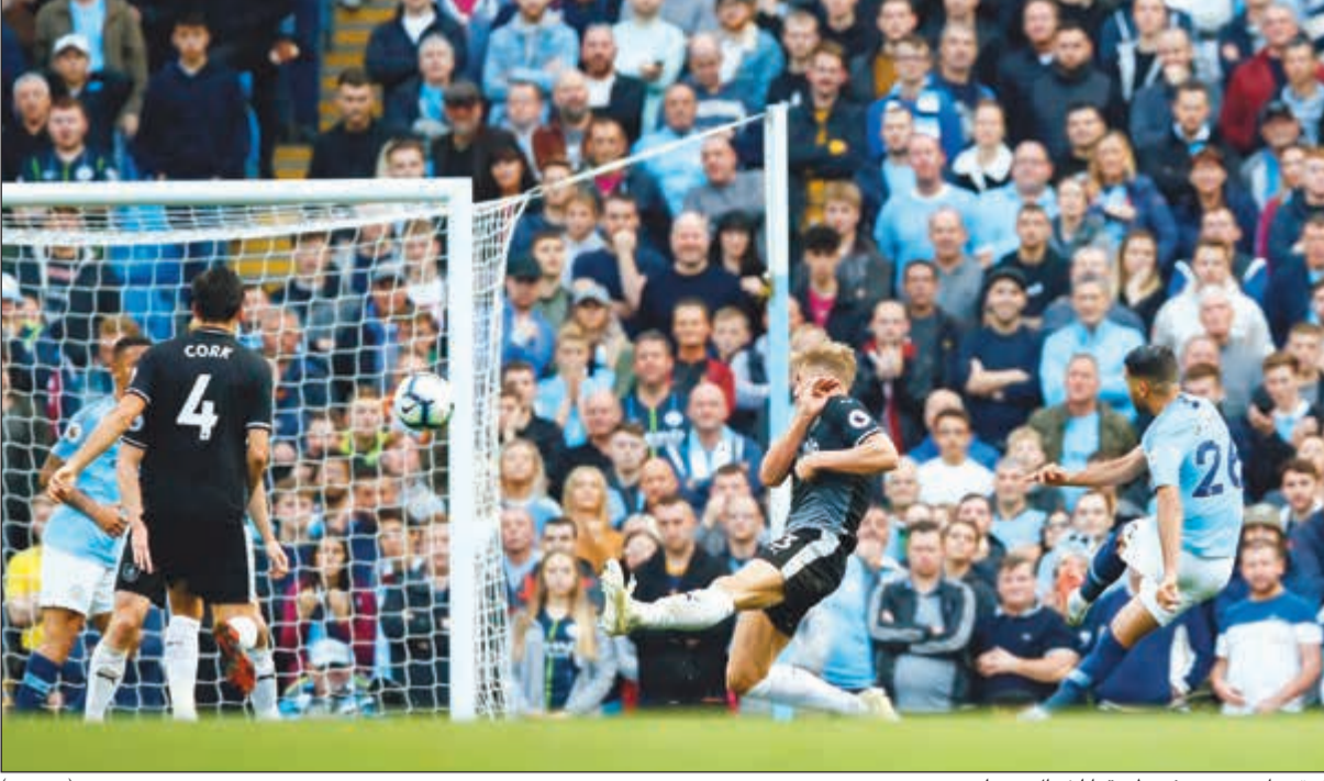
كرة رياض محرز في طريقها لشباك بيرنلي