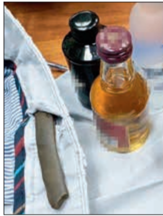
قطعة الحشيش مخبأة في بطانة الجاكيت

مبتكرة، مشسيرا الي ان اجهزة التفتيش التي تمر عليها جميع الامتعة قبل خروجها على السير رصدت وجود زجاجات خمر في احدى الحقايب فتم ابلاغ فريق الجواله في المطار وبمجرد ان تسلم الوافد حقيبته تم اقتنايه للتفتيش الذاتي وكانت المفاجأة انه لم يهرب الخمر فحسب، بل أخفى قطعة حشيش طولية في ملبسه حيث وضعها في بطانة الجاكيت الجينز الذي كان يرتديه واعترف الوافد بتهرب المواد المسكرة بالإضافة الي قطعة الحشيش.