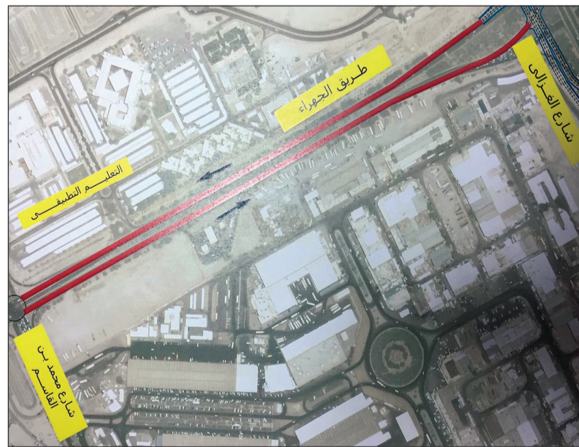
الطريق الذي سيتم افتتاحه