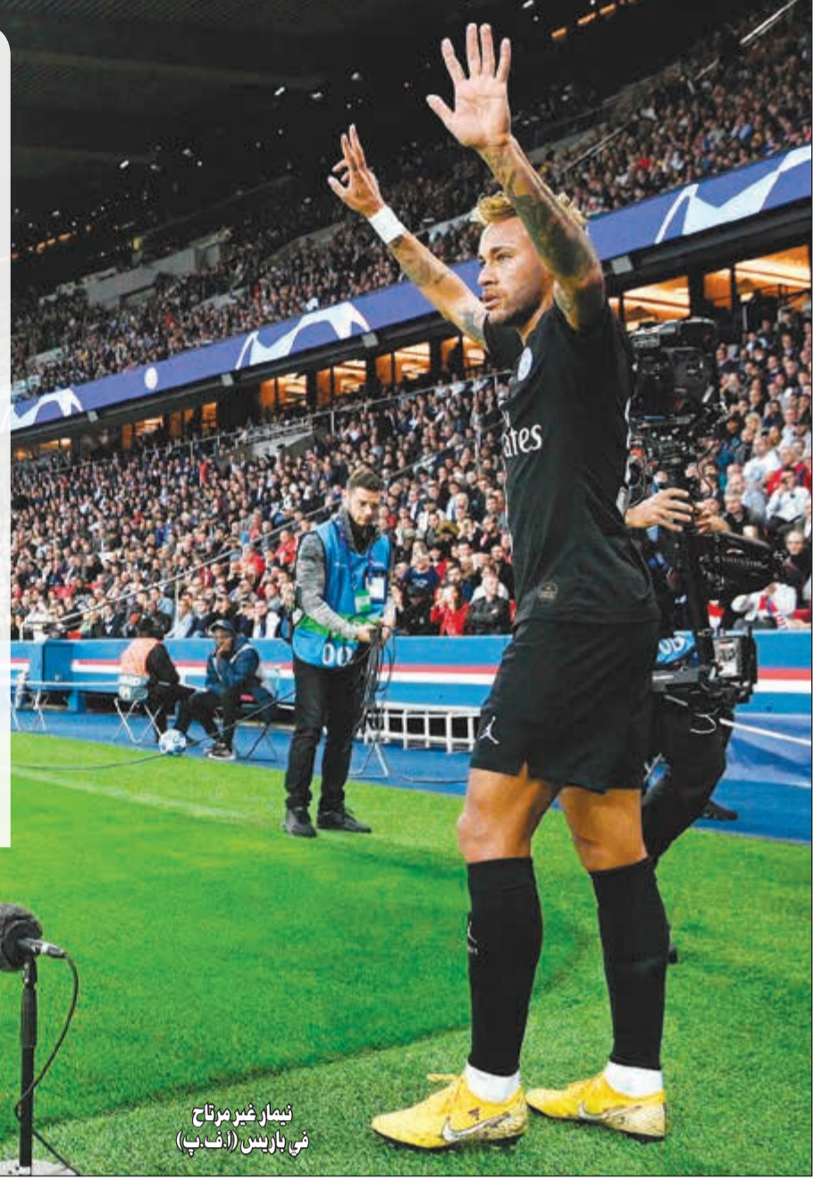
نيمار غير مرتاح في باريس

يوصل النجم البرازيلي نيمار توجيه رسائله إلى نادي برشلونة الإسباني بعد أكثر من عام من مغادرته النادي الكتالوني باتجاه باريس سان جرمان الفرنسي. وقالت صحيفة «موندو ديبورتيفو» الإسبانية إن نيمار وجه مؤخرا العديد من الرسائل عبر من خلالها عن رغبته في العودة إلى «البارسا». وأوضحت أن النجم البرازيلي غير مرتاح في باريس ويفتقد إلى الأجواء التي عاشها في برشلونة. وأشارت الصحيفة إلى أن نيمار يحتفظ بعلاقته مع العديد من نجوم العملاق الكتالوني، وأكدت أن اللاعب غير راض عن مستوى الدوري الفرنسي وعن طريقة تعامل لاعبي الفرق المنافسة معه. ووفقا للصحيفة الإسبانية، فإن إدارة