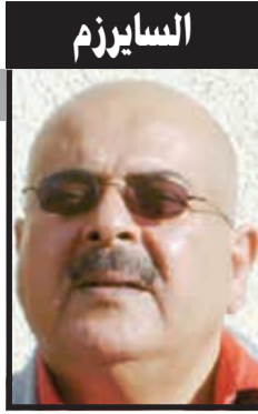
السايرزم صلاح السايير www.salahsayer.com @salah_sayer