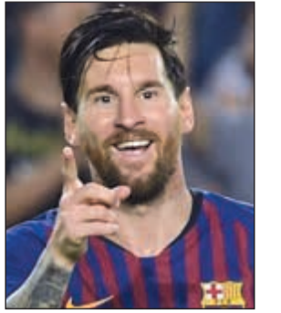
ليونيل ميسي يحظى بدعم ناديه

وقال المتحدث باسم النادي الكاتالوني، جوسيب بيبيس، رداً على مارادونا: «هناك عبارات تصف نفسها بنفسها، لدينا شخص يصف نفسه بنفسه مع التزام الصمت، ميسي