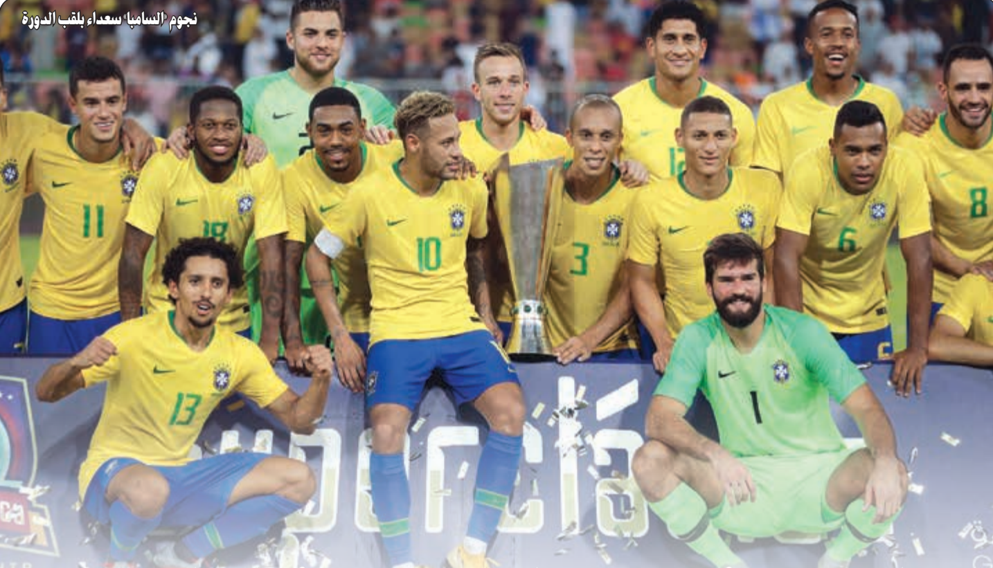
نجوم السامبا سعداء بلقب الدورة

سكالوني راضٍ عن أداء لاعبيه رغم الهزيمة.. ويكر يؤكد أن اللقاء لم يكن سهلاً