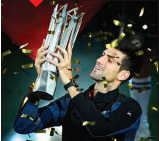
الصربي نوكا ديوكوفيتش يحمل كأس المركز الأول

اقترب الصربي نوكا ديوكوفيتش من استعادة المركز الأول في التصنيف العالمي من الإسباني رافاييل نادال بعد أن توج بطلا لدورة شغهاي الصينية، ثامنة دورات الماسترز لألف نقطة في التنس بفوزه على الكرواتي برنا تشوريتش 3-6 و4-6 في المباراة النهائية أمس. والتتويج هو الرابع لديوكوفيتش في شغهاي بعد أعوام 2012 و2013 و2015، فارتقت مرتبة واحدة في التصنيف العالمي الذي سيصدر اليوم، ليحتل المركز الثاني بفارق ضئيل (155 نقطة) عن الماتادور الإسباني الذي يعاني من إصابة في ركبته منذ بطولة الولايات المتحدة المفتوحة والذي أعلن انسحابه من شغهاي. واعتبر ديوكوفيتش بعد التتويج أن الأشهر الأربعة الأخيرة كانت «رائعة وأنا أستمتع بكل لحظة»، معتبرا دورة شغهاي «مكانا مميزا بالنسبة إليه». وعن منافسته نادال لاحتلال صدارة التصنيف العالمي قال: «لم أكن لأتوقع سيناريو أفضل من هذا، لقد اقتربت كثيرا من نادال في التصنيف العالمي ووضعت نفسي في وضعية جيدة بالقسم الأخير من العام».