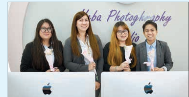
الورود تشيع البسمة بين الجميع