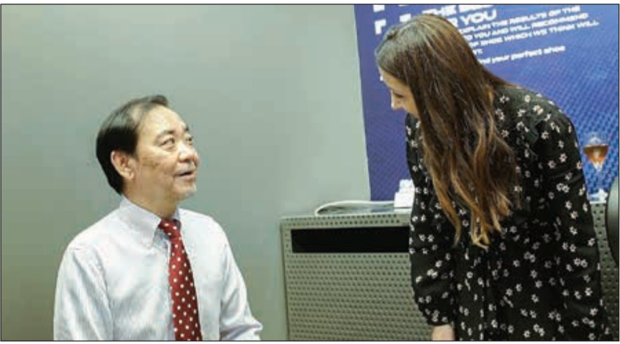
السفير الياباني تاكاشي أشيكي يجرب التكنولوجيا الجديدة موشن آي دي في محل أسيكس