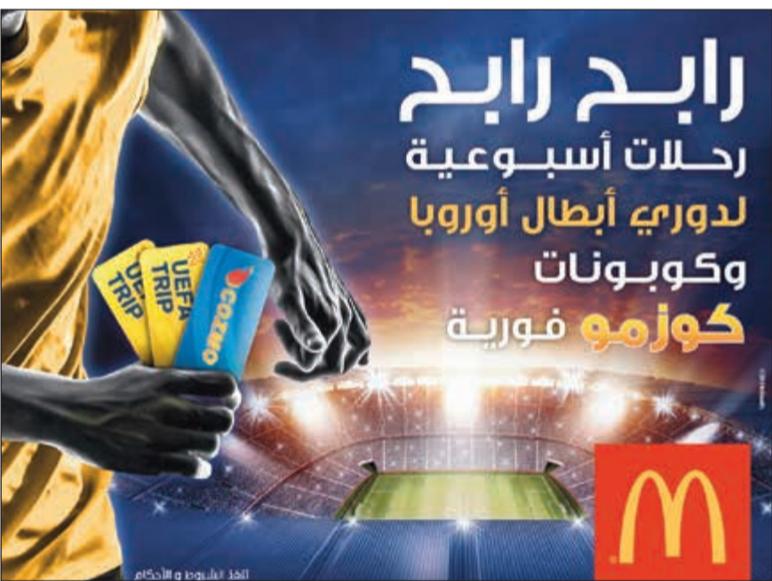
أنت الربيع مع ماكدونالدز

من جديد، ماكدونالدز تضيء لمسة بالحماض لعشاق ومشجعي كرة القدم مع حملة ترويجية جديدة مثيرة، حيث ابتداء من 13 أكتوبر تقدم ماكدونالدز لمحبي كرة القدم فرصة للفوز برحلة لحضور مباريات دوري الأبطال. ومن المقرر أن تستمر هذه الحملة لمدة شهر، وستتيح لعملائنا الفرصة لدخول السحب الأسبوعي للفوز برحلة لشخصين مدفوعة التكاليف لحضور مباراة ضمن دوري الأبطال، وذلك عند شراء أي وجبة قيمة من الحجم الكبير أو أي وجبة من التشكيلة الفاخرة من الحجم الكبير، إلى جانب الفوز بكوبون فوري بقيمة 2 دينار من كوزمو.