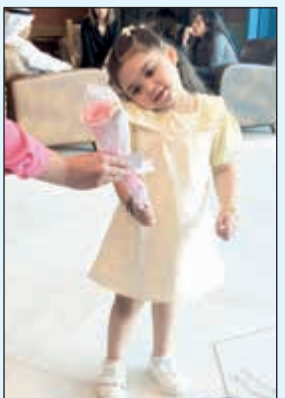
وردة لطفلة من زائرات «بوليفارد»