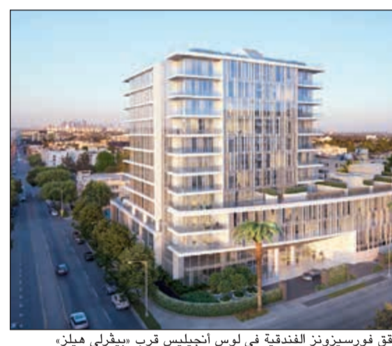
شقق فورسيزونز الفندقية في لوس أنجليس قرب «بيقرلي هيلز»

مستوى عالمي تقع في مكان هو الأكثر تميزاً بين بيقرلي هيلز وميلروز، وبالقرب من أفضل المطاعم والوجهات الثقافية والفنية ومتاجر الأزياء. وقد اجتمع أفضل المصممين والمهندسين المعماريين في العالم لإنشاء تصاميم حضرية 59 منزلاً خاصاً تضم خدمات ومرافق فورسيزونز. سيصبح هذا المشروع قريباً الوحدات السكنية الخاصة الأعلى طلباً في المدينة». وتعد الشقق الفندقية الخاصة من المشاريع الفريدة التي تقدمها المجموعة خارج فنادقها ومنتجاتها، وتوفر للضيوف أفضل المرافق والخدمات الراقية التي تناسب احتياجاتهم والتي يقدمها موظفو فورسيزونز. وتشارك فورسيزونز بشكل مباشر في عملية تصميم وتطوير كل مشروع سكني، وهي شركة الضيافة الوحيدة التي تدير العقار بالكامل وبشكل مستمر بعد تجهيزه، مع ضمان الحفاظ على أعلى مستويات الجودة والخدمة.