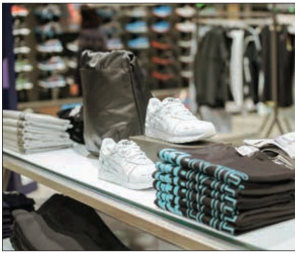
افتتاح محل أسيكس في الأقيونيوز