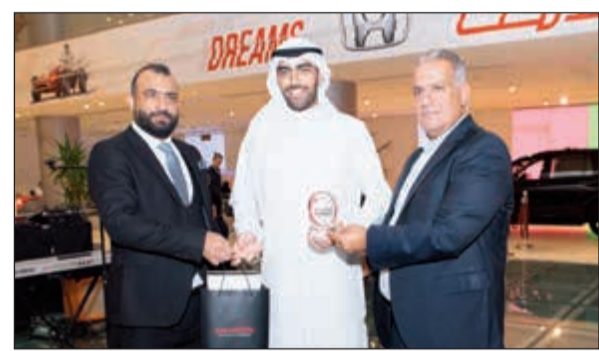
وفائز يتسلم تكريمه