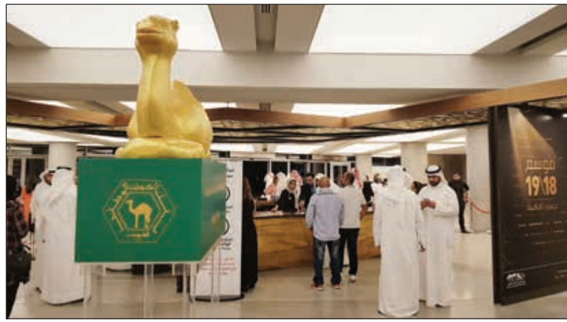
جانب من افتتاح «عودة الثمانينات»، في مركز الشيخ جابر الأحمد الثقافي بمشاركة «الوطني»