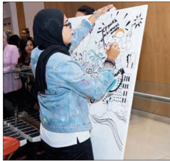
إحدى المشاركات في حملة «قوة الأحلام»