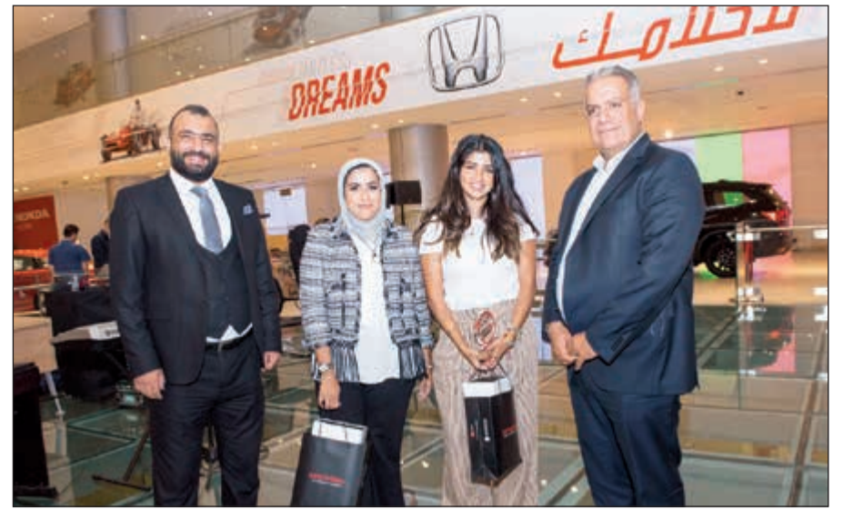
«هوندا الغانم» تحتفي بعملائها