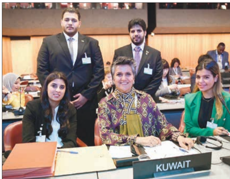
صفاء الهاشم متوسطة طلبة «العلوم السياسية» في اجتماع النساء البرلمانيات في جنيف

أعربت النائبة صفاء الهاشم عن اعتزازها وفخرها بتقدم المرأة في الكويت وأن عدد النساء المهندسات والطبيبات أكثر من زملائهن الذكور.