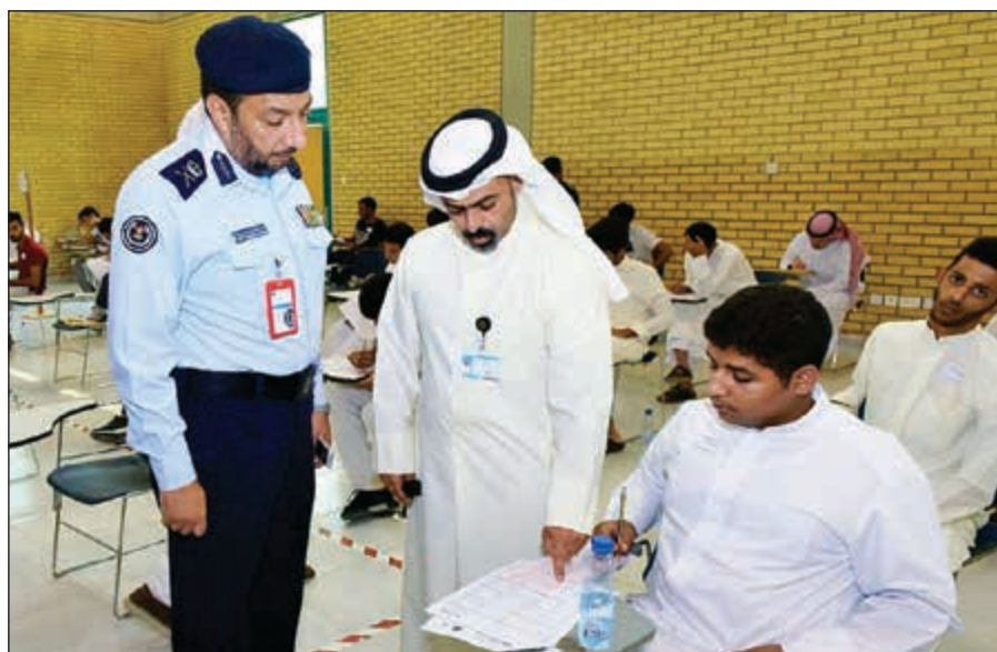
اللواء خالد التركيت يتفقد الاختبارات

أكد مدير عام الإدارة العامة للإطفاء بالإدارة اللواء المهندس خالد التركيت أن المتقدمين للالتحاق بدورة دبلوم هندسة الإطفاء والبالغ عددهم 190 شخصاً يتوجب عليهم اجتياز اختبارين، أحدهما نفسي والأخر علمي يتضمن مواد الفيزياء والكيمياء والرياضيات واللغة الإنجليزية بمعدل يفوق 50% لكل اختبار. جاء ذلك خلال جولة تفقدية للتركيت في المعهد الصناعي التابع لهيئة العامة للتعليم