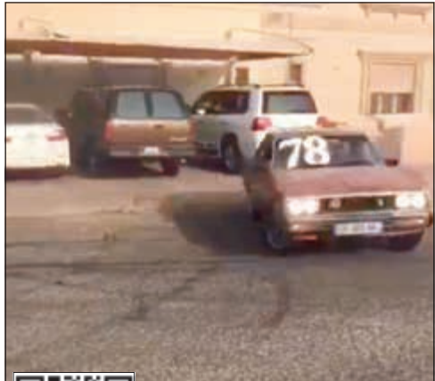
لوحة إحدى المركبات واضحة بالمقطع