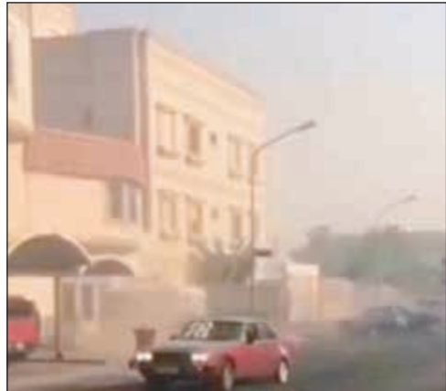
.. وأخرى حمراء يستهتر بها قائدها