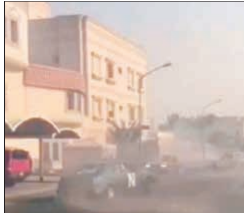
مركبة رياضية خضراء تحدث سحب من التراب