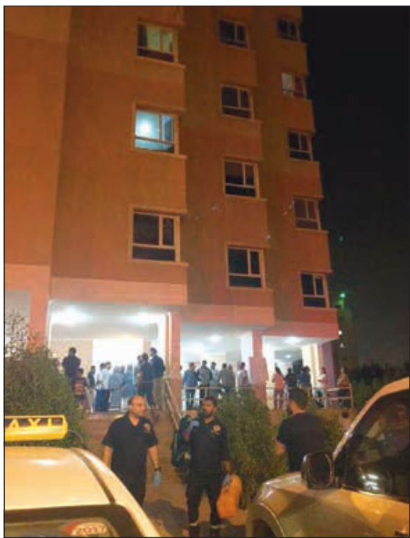
قاطنو البناية بعد أن تم إخلائها بالكامل

وقوع إصابات، واقتصرت الأضرار على الخسائر المادية، حيث التهمت النيران أثار الشقة المحترقة، وتم فتح تحقيق للوقوف على أسباب الحريق. من جهة أخرى، اخمد رجال الإطفاء حريقاً اندلع في منزل بمنطقة العيون، وكان مركز عمليات الإطفاء قد تلقى صباح اول من امس الجمعة بلاغا بنشوب الحريق، فتم توجيه فرق مركز إطفاء الجهراء الحرفي الى موقع البلاغ، وعند الوصول تبين ان الحريق اندلع بالدور الأرضي، وعلى الفور شرع رجال الإطفاء في مكافحة النيران حتى تمت السيطرة عليها وإخمادها دون وقوع إصابات. وفي سياق متصل، تعامل رجال الإطفاء مع حريق اندلع في منزل بمنطقة عبدالله المبارك، وكانت عمليات الإطفاء قد تلتقت بلاغا بالحريق، فتم توجيه رجال اطفاء مركز الجليب، وبمجرد الوصول تبين ان الحريق شب في المطبخ الخاص بالمنزل، فقام رجال الإطفاء بفصل التيار الكهربائي وإخلاء المنزل من سكانه، وتمت مكافحة الحريق والسيطرة عليه وإخماده تماما. بلاغا يفيد بنشوب حريق في شاحنة على طريق التعاون، فمقابل منطقة سلوى، فتم تحريك فرقة اطفاء مركز البدع وقام رجاله بالسيطرة على الحريق وإخماده بشكل كامل كما قاموا بتأمين المكان من الوقود المسرب من الشاحنة.