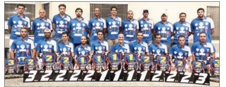
المنتخب الوطني للدراجات المائية الفائز ببطولة العالم

يصل إلى البلاد في الرابعة عصر اليوم قادماً من نيويورك، وقد الهية العام للرياضة للدراجات المائية الفائز بلقب بطولة العالم 2018 التي نظمتها الاتحاد العالمي للدراجات المائية في بحيرة ليك هافاسو بولاية أريزونا الأمريكية، وسقط مشاركة عالية لفرق ومنتخبات من 30 دولة، واستطاع من خلاله المنتخب الوطني حصد 13 ميدالية (4 ذهبيات - 7 فضيات - 2 برونزية) ليحافظ على صدارته ضمن المجموع العام للقطر وهي 300 نقطة، إلى جانب الولايات المتحدة وتايلند، فيما استطاع البطل العالمي وصاحب الرقم القياسي في ذهبيات بطولة العالم محمد بوريع تحقيق ذهبية فئة الجالس لكبار المحترفين GP runabout، ليكسر بذلك رقمه العالمي الذي حققه في بطولة العام الماضي بعدد 21 ميدالية ذهبية، والذي تم تسجيله في موسوعة غينيس للأرقام القياسية ليرفع رصيده من الميداليات الذهبية في بطولة العالم إلى 22 ميدالية خلال 12 عاماً متتالية، ويعزز بذلك تصنيفه الأول عالمياً، وصاحب أعلى رقم عالمي في تحقيق الميداليات الذهبية.