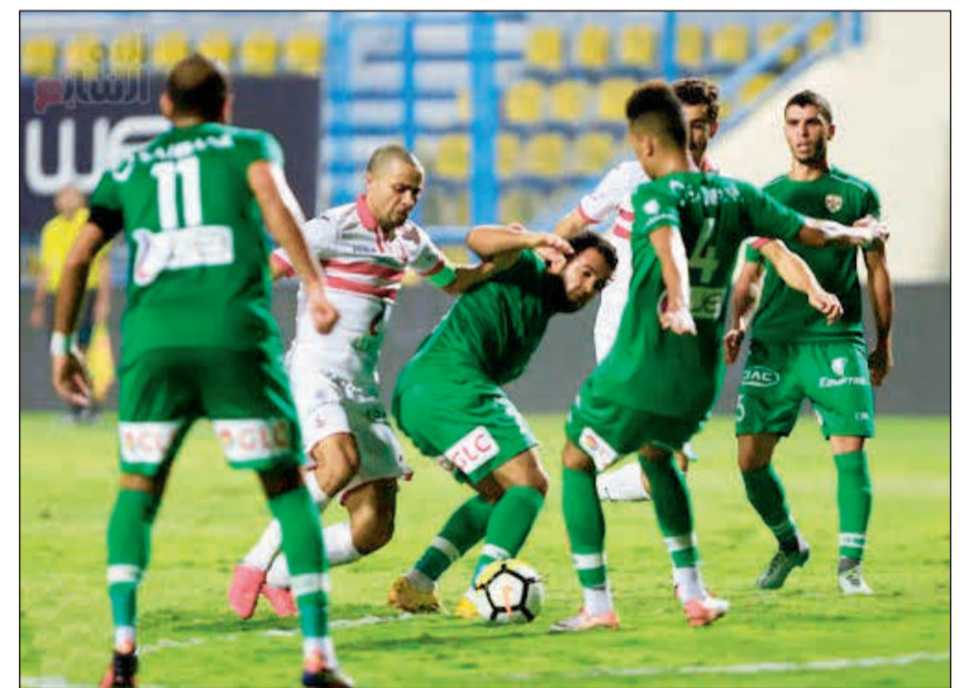
قتال على الكرة في المباراة