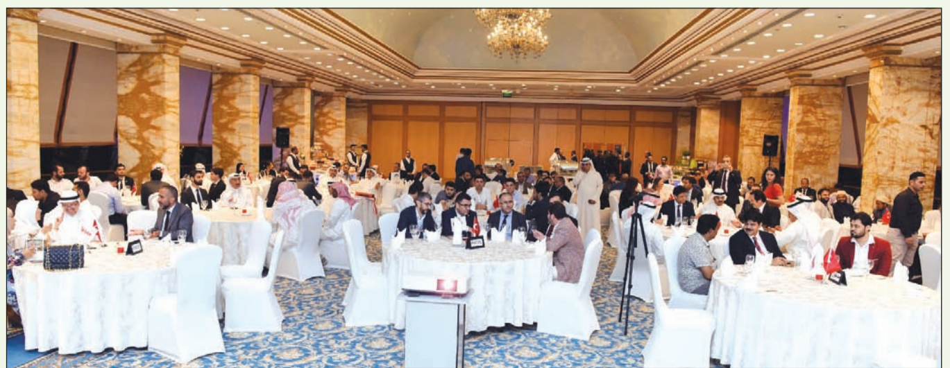
جانب من الحضور في الحفل الختامي لورشة العمل

وقال الفلاح: بصفتي واحدا من زبائن السياحة في تركيا فإننا نشعر بالسرور لدى