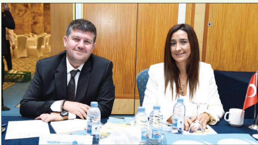
إحدى المؤسسات السياحية المشاركة