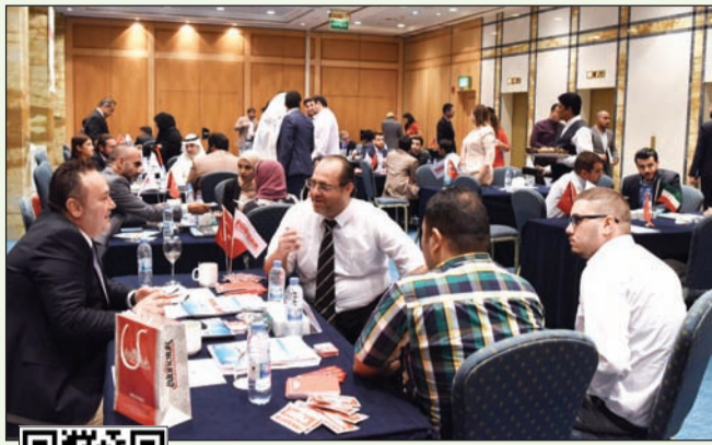
حضور شركات تركية وكويتية في ورشة العمل