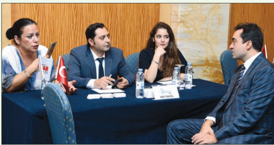
عدد من أعضاء اتحاد وكالات السياحة والسفر في الشرق الأوسط (أوتساد) خلال ورشة العمل