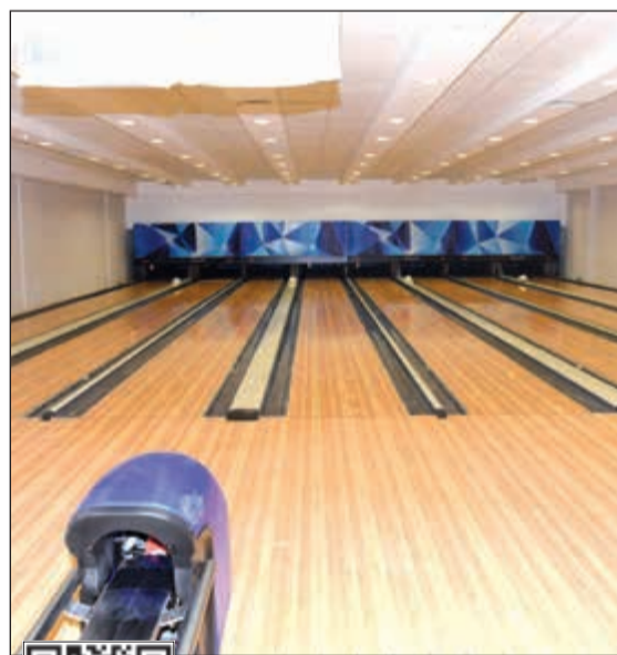
صالة البولنج الجديدة بنادي الشباب

ضمن منشآت النادي الجديدة، وذلك تقديراً لدورها وأحقيتها في ممارسة أنشطتها بكل أريحية. وأضاف: ستضاف أكثر من لعبة للفئات بالنادي خلال الفترة القصيرة المقبلة، لعل من بينها السباحة، حيث يوجد حوض سباحة مخصص للسيدات، بالإضافة إلى لعبة الإسكواش.