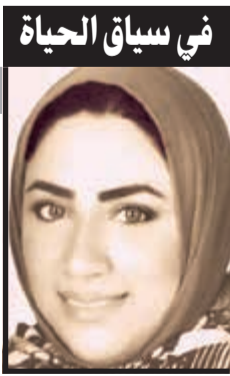
في سياق الحياة