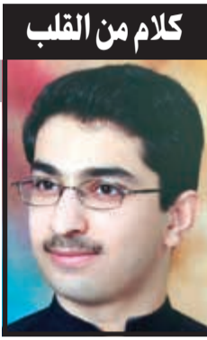
كلام من القلب

البيت الخليجي وعدم تطورها إلي أمور ليست في صالح أهل الخليج. سأقول لأحفادي كيف مضى سموه مسرعا إلى مكان الاعتداء الإرهابي في مسجد الصادق بعد الحادث بدقائق وعندما أشار بعض مراقبيه إلى أن الموقع ليس آمنا بعد رد عليهم بعبارة رسخت في أذهان الكويتيين وعلمتهم مدى معزتهم عند سموه (هذولا عيالي). سأخبر أحفادي عن شيخ جليل أخذ يجول العالم بعيدة وقربه، شرقة وغربه، ساعيا وباحثا عن كل ما فيه مصلحة للكويت