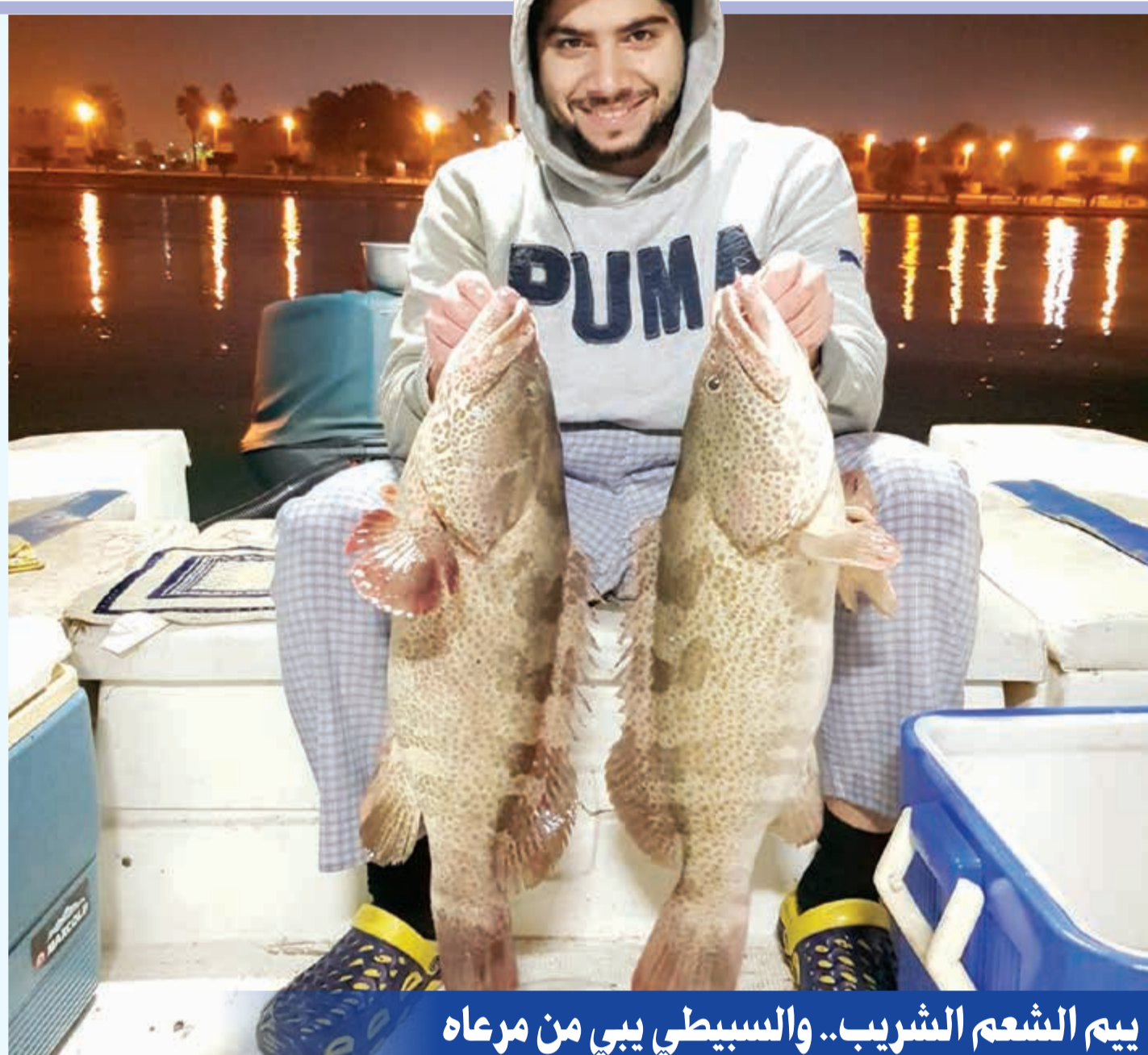
يوم الشمع الشريب.. والسبيطي يبي من مرعا