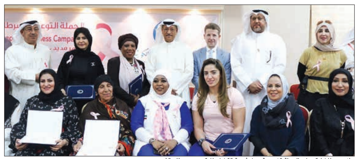
جانب من المشاركين في الحملة التوعوية حول أهمية الكشف المبكر عن سرطان الثدي