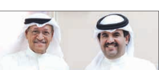
عادل الدشتي مترئساً وفد الكويت

بحث خلال اجتماعها جدول الأعمال الذي أعدته الأمانة العامة لدول المجلس منها قانون نظام النقل البري الموحد وكذلك توحيد مواصفات أنظمة النقل الذكية، بالإضافة إلى مناقشة دليل إرشادي للممارسات في مجال السلامة المرورية وتوحيد بيانات بطاقات التشغيل الخاصة بالنقل. وأشار إلى أن اللجنة تطرقت خلال اجتماعها لمناقشة تطوير سبل التعاون مع الدول الأجنبية والمنظمات المتخصصة في مجال النقل البري.