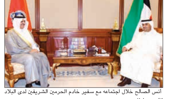
آنس الصالح خلال اجتماعه مع سفير خادم الحرمين الشريفين لدى البلاد الأمير سلطان بن سعد

المشترك. وذكر بيان صادر عن مكتب وزير الدولة لشؤون مجلس الوزراء آنس الصالح أشاد خلال استقباله السفير السعودي في مكتبه بقصر السيف بالمستوى «المتن» للعلاقات الثنائية وسبل تطويرها بما يخدم المصالح المشتركة.