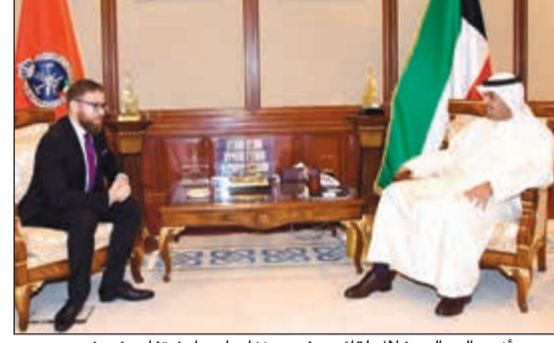
آنس الصالح خلال اجتماعه مع سفير خادم الحرمين الشريفين لدى البلاد الأمير سلطان بن سعد