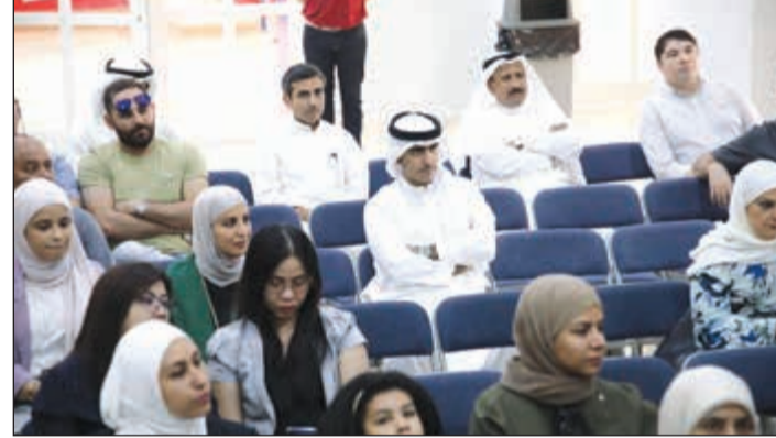
جانب من أولياء الأمور يتابعون شرح المدرسات خلال الفعالية