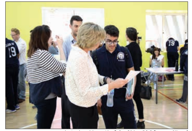
أحد طلاب مدرسة البكالوريا الأمريكية يتلقى جوابا عن استفساره