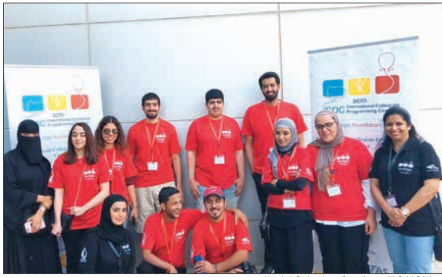
مشاركة كلية الكويت التقنية في المسابقة العام الماضي