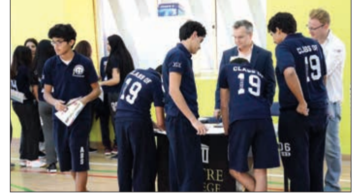
طلاب مدرسة البكالوريا الأمريكية في إحدى قاعات المدرسة