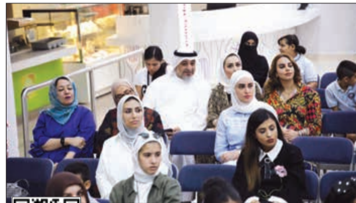
أولياء أمور يتابعون أبناءهم عن قرب