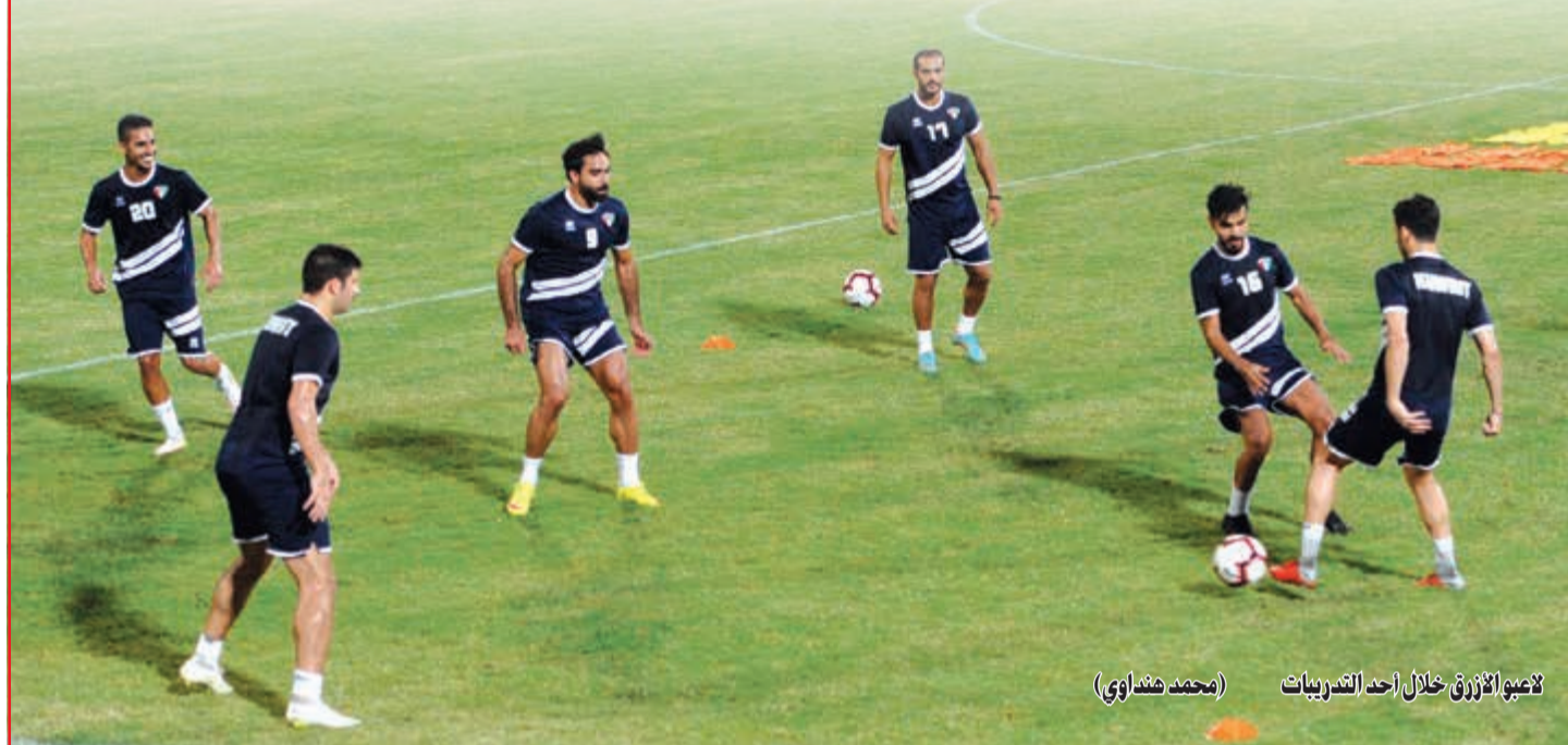
لاعبو الأزرق خلال أحد التدريبات (محمد هنداوي)

تأتي استكمالاً لخطة اللجنة الفنية للمباريات الودية، ونكر أن المنتخب أجرى عدداً من الحصص التدريبية بالإضافة إلى انتظامه في معسكر داخلي للمزيد من التجانس بين اللاعبين. وعن المنتخب الأول، قال الديحاني أنه تم تجهيزه وإعداده بشكل مشابه للمنتخب الأولمبي من حيث المعسكر الصيفي والمباريات الودية استعداداً للاستحقاقات المقبلة، ومنها كأس العالم 2022.