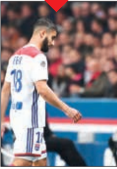
نيل فقير غادر الملعب مبكراً في لقاء باريس

وسجل الباراغوياني هرنان بيريز (7) وسيرجي داردير (79) وبابلو أنيغال بيتي (2+90) أهداف إسبانيول الذي رفع رصيده إلى 14 نقطة، والكاميروني كارل توكو إيكامي (45) هدف فياريال الذي منى بخسارته الثانية تواليًا والرابعة هذا الموسم فترجع إلى المركز الخامس عشر.