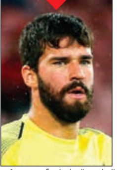
الحارس البرازيلي أليسون بيكر

بدأت مجلة «فرناس فوتبول» الفرنسية أمس الكشف تباعاً عن لائحة اللاعبين الـ 30 المرشحين لنيل جائزة الكرة الذهبية لأفضل لاعب في العالم، وأبرزهم في الدفعة الأولى التي تضمنت 10 لاعبين، البرتغالي كريستيانو رونالدو (يوفنتوس الإيطالي) الفائز بها 5 مرات. ونشرت المجلة في حساباتها على مواقع التواصل الاجتماعي الدفعة الأولى من الأسماء (10 لاعبين) بحسب الترتيب الأبجدي، وتضمنت إلى رونالدو، الأرجنتيني سيرخيو أغويرو والبلجيكي كيفن دي بروين (مان سيتي الإنجليزي)، الحارس البرازيلي أليسون بيكر ومواطنه روبرتو فيرمينو (لغزبول الإنجليزي)، اليزلي غاريت بايل والفرنسي كريم بنزيمة والحارس البلجيكي تيبو كورتوا (ريال مدريد الإسباني) والأوروغوياني ديفغو غودين (أتلتيكو مدريد الإسباني)، ادينسون كافاني (باريس سان جرمان الفرنسي).