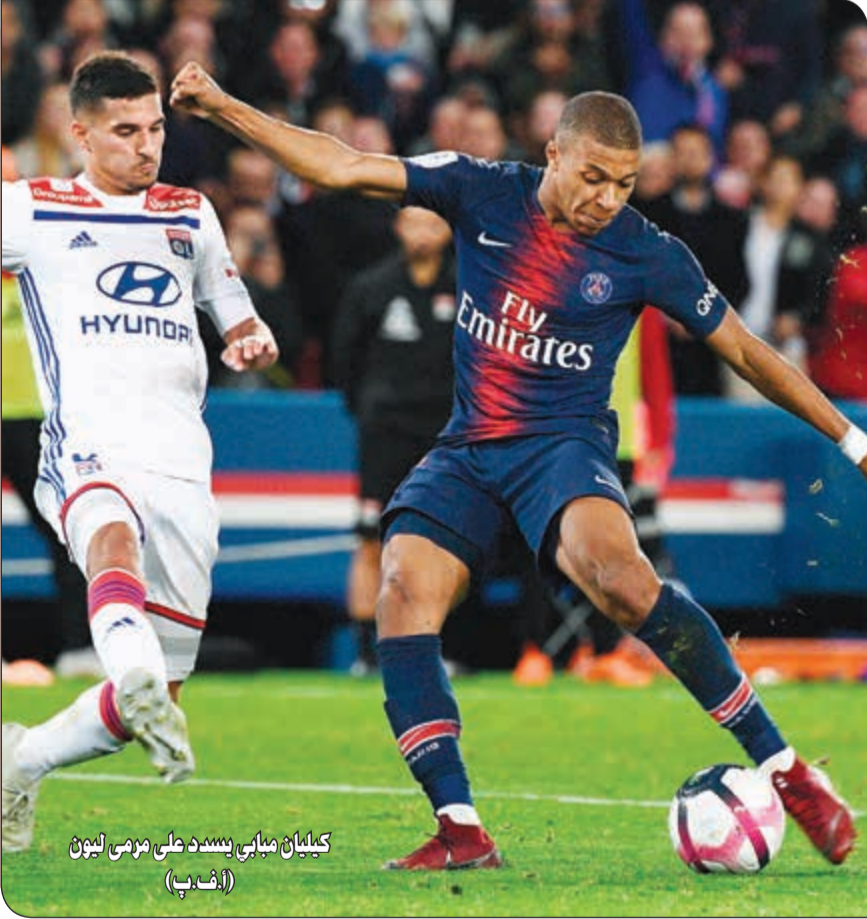
كيليان مبابي يسدد على مرمرى ليون

كرة من الدولي الكرواتي إيفان بيريسيتش داخل المنطقة فلعبها على يسار الحارس السنغالي ألفريد غوميس (78)، فيما سجل البرنو بالوسكي هدف الشرف لأصحاب الأرض (72)، وذلك في المرحلة الثامنة من الدوري الإيطالي على ملعب «باولو ماتاز»، وأهدر ميركو أنتينوفيتش ركلة جزاء لسبال في الدقيقة 17. ورفع إنتر ميلان رصيده إلى 16 نقطة.