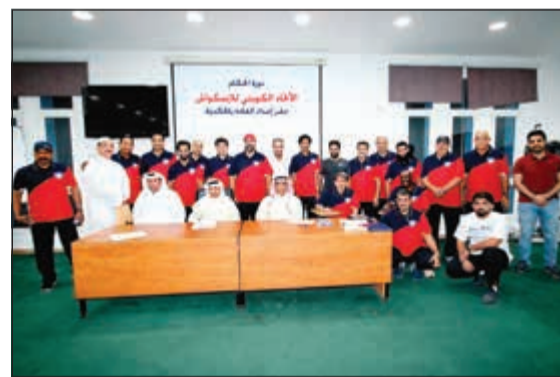
لقطة جماعية للمشاركين في الدورة

وحيث أن التحكيم في أي لعبة رياضية أحد أهم عناصر نجاح هذه اللعبة وهذا يتطلب الحرص دائما على الاهتمام بزيادة معارف الحكام في قانون اللعبة وإطلاعهم بصفة دائمة ومستمرة على المستجدات ورفع مهاراتهم الفنية، حيث إن كل ذلك سيرفع من مستوى مهارات الحكام في فن التحكيم، وهذه الدورة التي تقام بالتعاون مع مركز عبدالله السالم لإعداد القادة خير دليل على ذلك. يذكر أن 30 حكما مسجلا بالاتحاد يدرسون في الدورة.