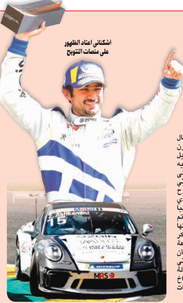
أشكناني اعتاد الظهور على منصات التتويج

يستعد للمشاركة في ختام «بورشه سوپر كاب 2018» في المكسيك 26 أكتوبر