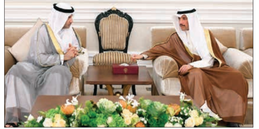
رئيس مجلس الأمة مرزوق الغانم مع أمين سر المجلس د. عودة الرويعي

وصل رئيس مجلس الأمة مرزوق الغانم على رأس وفد برلماني أمس الاثنين إلى مدينة أنطاليا التركية للمشاركة في الاجتماع الثالث لرؤساء البرلمانات الأوروبية - الآسيوية، وذلك لتلبية لدعوة رسمية من رئيس مجلس الأمة التركي الكبير بن علي يلدرم. وكان في استقبال الغانم على أرض المطار نائب والي مدينة