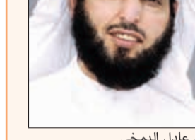
د. عادل الدمخي

وجه النائب د. عادل الدمخي سؤالاً إلى نائب رئيس مجلس الوزراء وزير الدولة لشؤون مجلس الوزراء انس الصالح طالب فيه بتزويده بعدد طلبات الاستثناءات من شروط شغل المناصب الإشرافية لدى ديوان الخدمة المدنية في جميع جهات الدولة، كما طالب بتزويده بأسماء من تم قبول طلباتهم، وكذلك الآلية التي تم من خلالها قبول الاستثناءات لدى ديوان الخدمة المدنية.