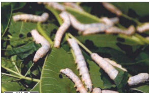
صناعة الحرير ببغلاديش ترنحت في الايام الماضية