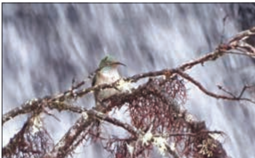
عصفور الطنان الجديد