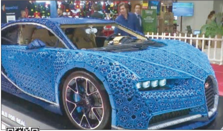
نموذج سيارة بوجاتي المصمم من قطع الليجو