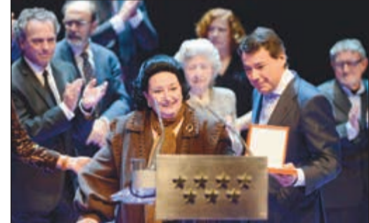
كاباييه لدى منحها جائزة فنية دولية عام 2013