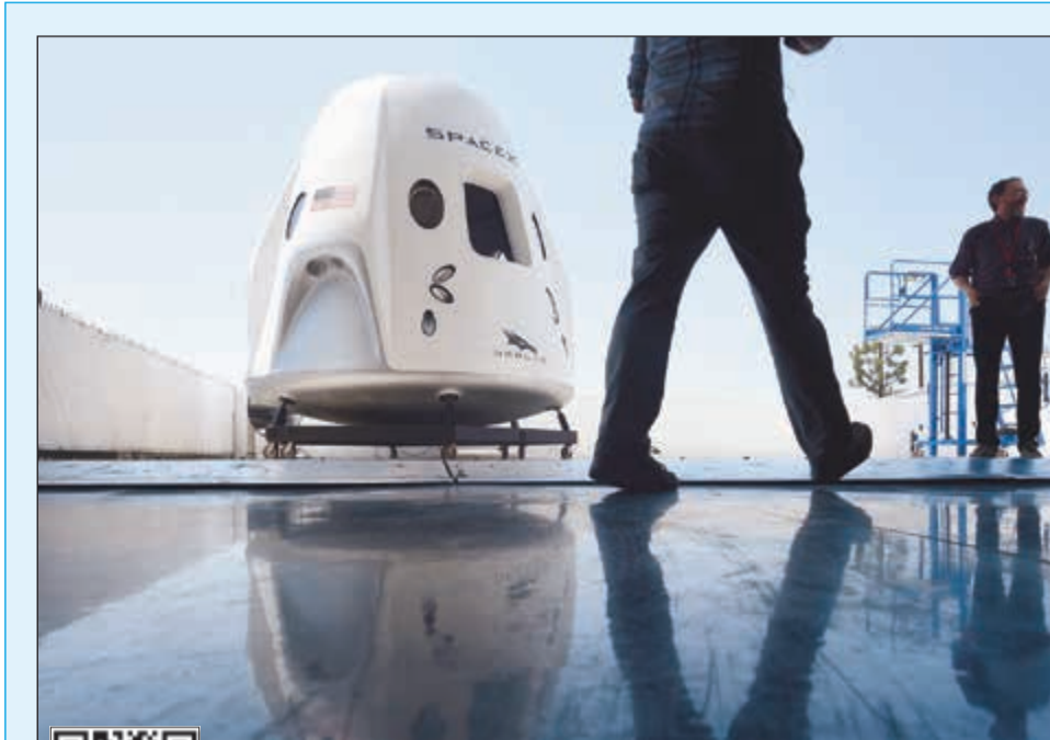
صورة التقطت للمركبة الفضائية في مصنع سبايس أكس للصاروخ