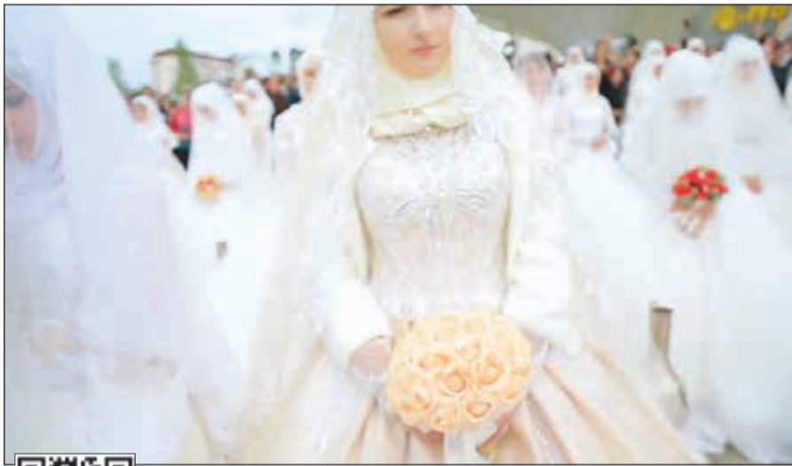
العرائس حملن الزهور خلال الاحتفال