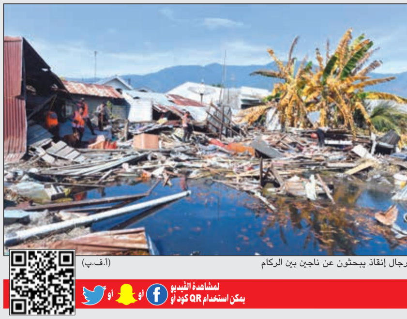
رجال إنقاذ يبحثون عن ناجين بين الركام

د.ب: تم التوصل إلى أن اثنين من الملوثات، يتسببان في المتوسط في 1,1 مليون حالة وفاة مبكرة في الصين، سنويا، كما يدمران 20 مليون طن من الأرز والقمح والذرة وفول الصويا. وتوصلت دراسة حديثة نشرتها صحيفة «ساوث تشاينا مورنينج بوست»، إلى أن تلوث الهواء بسبب الأوزون والجسيمات الدقيقة، المسببين للضباب الخاخي، قد يؤدي إلى هدر ما يقدر بنحو 267 مليار يوان (38 مليار دولار أميركي)، من الاقتصاد الصيني سنويا، وذلك في صورة وفيات مبكرة وخفض إنتاج الغذاء. وتوصل باحثون من جامعة هونغ كونغ الصينية إلى هذه الأرقام، من خلال حساب التكاليف الاجتماعية لتلوث الهواء، والتأثير على الصحة العامة وخفض إنتاج المحاصيل.