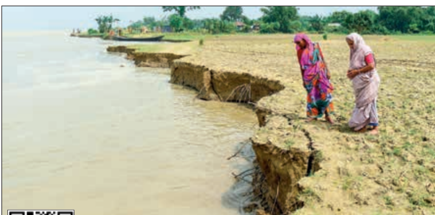
ضفاف نهر بادما تتآكل بسبب ارتفاع منسوب المياه