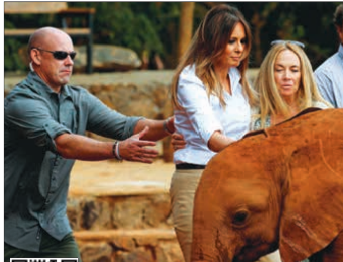
أحد الحراس يتقدم لحماية ميلانيا ترامب من الفيل الصغير