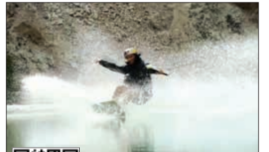
أحد المتدربين في الموقع المهجور