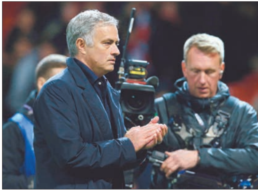
جوزيه مورينيو يعيش فترة صعبة مع اليونانيد

أقر المدرب البرتغالي جوزيه مورينيو بأن الأداء الذي يقدمه فريقه مان يونانيد الإنجليزي ليس جيدا بما يكفي، وذلك في تصريحات عشية استضافته نيوكاسل يونانيد في الدوري اليوم. وفي مؤتمر صحافي مقتضب عقده صباح امس، قال مورينيو ردا على سؤال عما اذا كان يوافق على أن هذه النتائج ليست جيدة بما يكفي لناد من هذا الحجم، أجاب: «أنا موافق». وردا على سؤال عن أسباب هذا الأداء، قال: «أسباب مختلفة»، ورد بـ «كلا» على