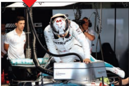
لويس هاميلتون عقب الانتهاء من التجارب

هيمن البريطاني لويس هاميلتون سائق مرسيدس أمس على التجارب الحرة لجائزة اليابان الكبرى، المرحلة الـ 17 من بطولة العالم في الفورمولا واحد، ووجه ضربة إضافية للألماني سباستيان فيتل الطامح للحاق بصدارته. لكن بطل العالم الحالي الذي يتقدم سائق فيراري بخمسين نقطة قبل خمس مراحل على نهاية الموسم، نجا من حادث على حلبة سوزوكا متقاديا الاصطدام بسيارة الفرنسي بيار غاسلي (تورو روسو)، وسجل هاميلتون الوقت الأسرع في الجولتين الأولى (1:28,691 دقيقة) والثانية (1:28,217)، متقدما بفارق نصف ثانية على زميله الفنلندي فالتييري بوتاس. وقال هاميلتون (33 عاما) عبر جهاز الراديو «هذه الحلبة رائعة، هذا أفضل يوم لي»، وحل فيتل ثالثا بفارق ثمانية أعشار من الثانية عن هاميلتون الذي يتساوى معه بـ 4 ألقاب عالمية. وعبر هاميلتون عن غضبه من الطريقة التي قلص فيها غاسلي من سرعة سيارته على المسار وكاد يتسبب في حادث قوي مع سائق مرسيدس.