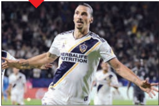
زلتان إبراهيموفيتش خارج اهتمامات ميلان

أغلق المدير الرياضي لنادي ميلان الإيطالي، البرازيلي ليوناردو، الباب أمام احتمال عودة النجم السويدي زلاتان إبراهيموفيتش إلى صفوف فريقه السابق لكنه اعترف بأنه فكر في مفاتحة ناديي الحالي لوس أنجيليس غالاكسي الأميركي بالأمس. وكانت صحيفة «كورييري ديلا سيرا» زعمت أن «إبرا» يرغب في العودة إلى ميلان في ديسمبر المقبل لدى توقف الدوري الأميركي، لكن ليوناردو قال لشبكة «سكاي سبورت إيطاليا» إنه لا مخطط لجلب السويدي المخضرم إلى ميلان.