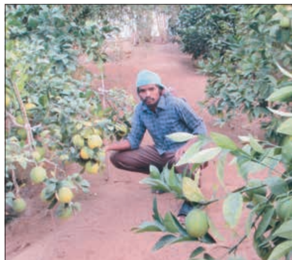
بساتين الكويت تجود بالحمضيات المتنوعة

جميع العناصر الغذائية بتقديم الأعلاف المركزة. ● تقديم الأعلاف الطازجة الى الأبقار دون تركها تتعرض للربوطة لأن ذلك يسبب الانتفاخ في الأبقار. الأغنام يجب تغذية الحيوانات على الأعلاف المركزة بجانب الأعلاف الخضراء، وذلك لإنتاج حملان قوية وسليمة، كما يجب تحصين الحيوانات ضد الأمراض السارية، وذلك وفقا لبرنامج التحصين بإدارة البيطرة بالهيئة العامة لشؤون الزراعة والثروة السمكية.