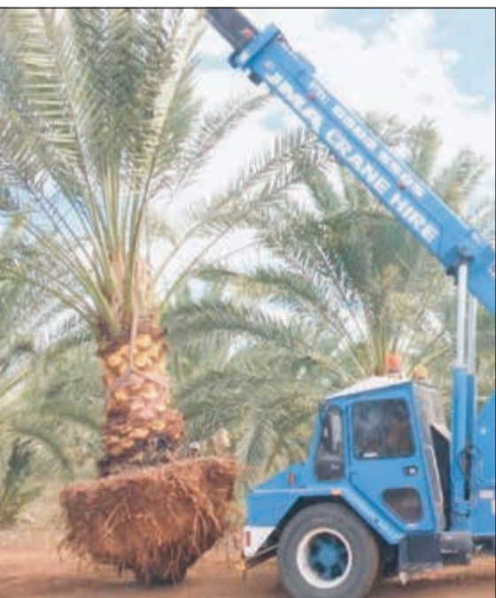
معد زراعة الفسائل في الكويت

والنعناع والفجل والجزر والجبث والسلفم والشمندر والبسلة والبقول والشوم والذرة الصفراء والبيضاض والقمح والشعير والقراولة. كما يجب ملاحظة ومتابعة نمو ما تمت زراعته من أشاتل الفلفل والباذنجان والطماطم وغيرها وترقيع (تتبع) الحفر الغائبة. الأزهار الشتوية في هذا الشهر تنتم زراعة معظم الأزهار الشتوية مثل القرنفل المنثور، البتونيا، الأقحوان، قم السمكة، البانسيا، الأستر، ابونجخر، ديمورفوتیکا، وغيرها. كما يمكن زراعة الأنصال الشتوية مثل: الكلابيولا، النرجس، التوليب، الفريزيا، وغيرها ويفضل زراعتها على دفعات داخل الأحواض المعدة لها حتى لا تزهر كلها مرة واحدة ولضمان استمرار التزهير فترة أطول.