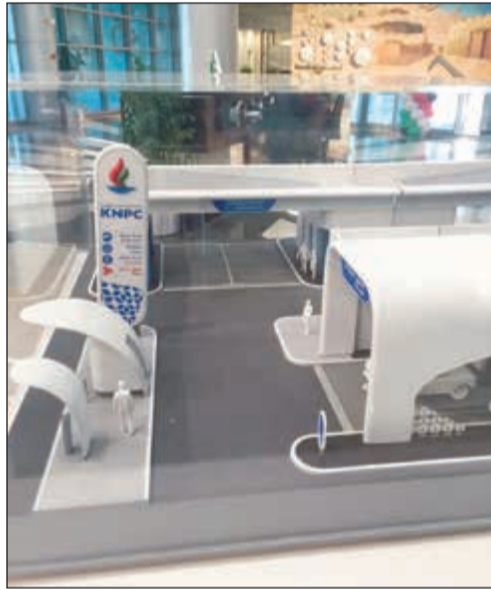
نموذج محطات الوقود الجديدة التي ستنفذها شركة البترول الوطنية

كشف مصدر نفطي مسؤول لـ «الأنباء» عن أن شركة البترول الوطنية الكويتية تقوم حالياً بتنفيذ وتصميم 16 محطة وقود جديدة في المناطق السكنية الجديدة بمدينة صباح الأحمد والخيران ومنطقة الوفرة السكنية، مشيراً إلى أن كل جهود الشركة تصب في سرعة إنجاز 10 محطات وقود جار تنفيذها حالياً في تلك المناطق والانتهاج من تنفيذها وتسليمها بحلول الربع الثاني من السنة المالية 2019-2020. وقال المصدر إن 10 محطات الجاري تنفيذها في منطقة صباح الأحمد وتوسعة الوفرة ستكون على أحدث طراز معماري فريد يلبي احتياجات سكان تلك المناطق مستقبلاً. وأشار إلى أن الشركة تقوم حالياً بتصميم 6 محطات في مدينة صباح الأحمد والعريفجان ومزارع الوفرة، ويتوقع تسليمها بحلول الربع الثالث من السنة المالية 2020-2021. وذكر أن منطقة صباح الأحمد تتضمن 9 محطات من المرحلة الأولى، بالإضافة إلى 5 محطات في منطقة جابر الأحمد، و2 في منطقة سعد العبدالله و3 محطات في العديلية والوفرة وشمال غرب الصليبخات، لاسيما أن الكثافة السكانية في تلك المناطق عالية وهو ما دفع الشركة إلى تكثيف عدد المحطات بها.