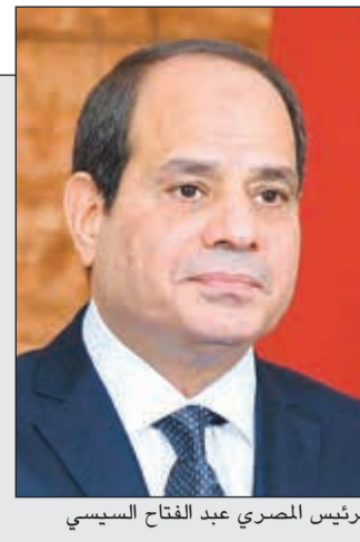
الرئيس المصري عبد الفتاح السيسي