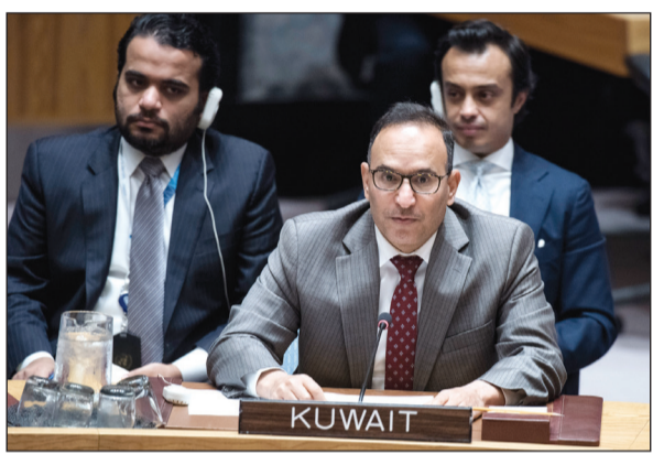
السفير منصور العتيبي خلال الاجتماع

وآشاد العتيبي بالدور الذي تقوم به اللجان الفرعية في مجال مكافحة الإرهاب من تعاون فيما بينها وهيئات الأمم المتحدة المعنية الأخرى مثل مكتب الأمم المتحدة المعنى بالمخدرات والجريمة