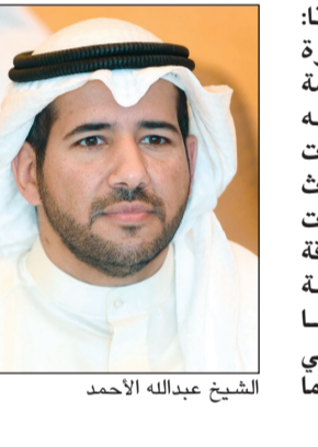
الشيخ عبدالله الأحمد

الرياح بما يمكن من خفض وتقليل الانبعاثات الضارة من محطات توليد الكهرباء والاتجاه نحو الطاقة النظيفة والبدئية. وأوضح ان هذه المؤتمرات العلمية الدولية تفتح الباب امام الوصول الى افضل الممارسات العالمية في هذا المجال من ثم تطبيقها في الكويت. وقال ان طاقة حديثة موقوفة ومستدامة جزء من أهداف الأمم المتحدة