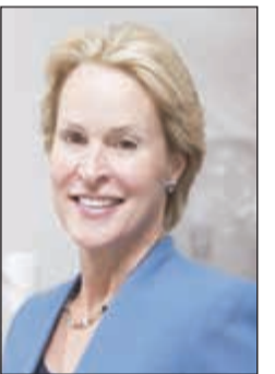
فرانسيس آر نولد

أ.ف.ب: منحت جائزة نوبل للكيمياء 2018 الأربعة إلى الأميركية فرانسيس غريغوري. آر نولد ومواطنها جورج ب. سميث والبريطاني غريغوري ب. وينتر لأعمالهم حول التطور الموجه والأجسام المضادة والبيبتيدات التي سمحت بتسخير مبادئ نظرية التطور لأغراض علاجية وصناعية. ونالت آر نولد نصف الجائزة فيما منح نصفها الآخر إلى سميث (77 عاما) ووينتر (67 عاما). وترافق الجائزة مع مكافأة مالية قدرها تسعة ملايين كرونة سويدية (1,01 مليون دولار). وأرنولد هي خامس امرأة تفوز بنوبل الكيمياء منذ استحداها العام 1901. وقد نالت هذه الجائزة قبلها ماري كوري (1911) وإيريس جوليوكوري (1935) ودوروثي كروفوت هودجكين (1964) وآدا يونان (2009).