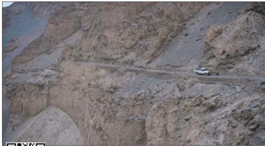
سيارة تسير في وادي شيمشال بمنطقة هونزا شمال باكستان