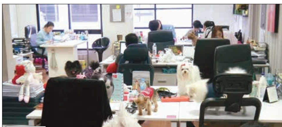
هل وجود الكلاب في مكان العمل يخفف التوتر؟