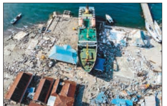
زورق جرفته موجات التسونامي ليصطدم بأحد المنازل

توكتمت الجثث خارج مستشفى في بالو في اندونيسيا مع ارتفاع عدد ضحايا الزلزال وموجات المد العاتية (تسونامي) لأكثر من 1400 قتيل. وأظهرت لقطات حملت على موقع الجثث داخل أكياس مخصصة لحفظها أو مغطاة ببطاطين أمام المستشفى، وقال المركز الوطني لمكافحة الكوارث في إندونيسيا أمس الأربعاء إن عدد القتلى المؤكد جراء زلزال وأماج مد عاتية في جزيرة سولاويسي الإندونيسية ارتفع إلى 1407 أشخاص. وضرب الزلزال الذي بلغت قوته 7,5 درجات الساحل الغربي لجزيرة سولاويسي وأعقبته أمواج مد عاتية يوم الجمعة الماضي (28 سبتمبر). ويخشى مسؤولون ارتفاع عدد القتلى نظرا لأن معظم حالات الوفاة المؤكدة جاءت من بالو، وهي مدينة صغيرة بعد 1500 كيلومتر شمال شرقي جاكارتا، كما لم يتم بعد حصر الخسائر في المناطق النائية المعزولة إذ انقطعت الاتصالات ودمرت الكباري والطرق أو أُلغقت بسبب انهيارات أرضية.