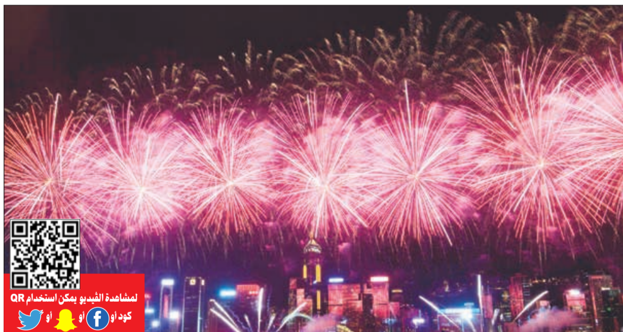
الألعاب النارية تضيء السماء فوق ميناء فيكتوريا

احتشد الألوف في ميناء فيكتوريا بهونغ كونغ يوم الاثنين الماضي لمشاهدة عرض للألعاب النارية أقيم احتفالاً بالعيد الوطني الـ 69 لجمهورية الصين الشعبية.