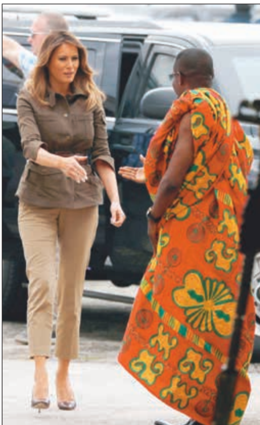
ميلانيا ترامب في غانا

د.ب: زارت سيدة أميركا الأولى ميلانيا ترامب امس الأربعاء إحدى «قلوع العبودية» في مدينة كيب كوست في غانا، وكان يستخدم في السابق كمركز لتجارة العبيد عبر المحيط الأطلسي، وتعد غانا أول محطة في جولة ميلانيا التي تشمل أربع دول أفريقية، وتعد أول جولة خارجية لها بدون الرئيس الأميركي دونالد ترامب.