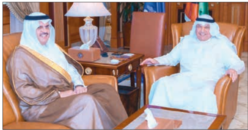
الفريق متقاعد الشيخ خالد الجراح مستقبلاً السفير السعودي الأمير سلطان بن سعد بن خالد

بحث مع سفير المملكة العربية السعودية سبل تعزيز العلاقات الأمنية بين الجانبين. من جانبه أكد الأمير سلطان بن سعد أهمية الموضوعات التي تم طرحها خلال اللقاء مشيراً في الوقت ذاته إلى توافق الرؤى والمواقف حول أهم الملفات المحلية والدولية بين البلدين الشقيقين. وفيما يتعلق ببقاء الجراح مع السفير الأردني استعرض الجانبان خلال اللقاء العديد من الملفات التي من شأنها تعزيز العلاقات الأمنية بين البلدين حيث فمن الجراح أوجه التعاون المتفرع والبناء بين البلدين.