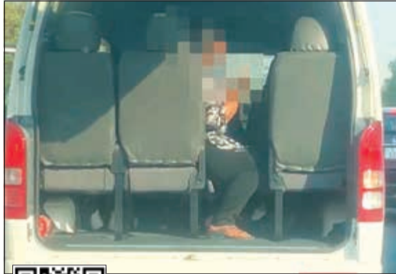
لقطة من الفيديو المتداول