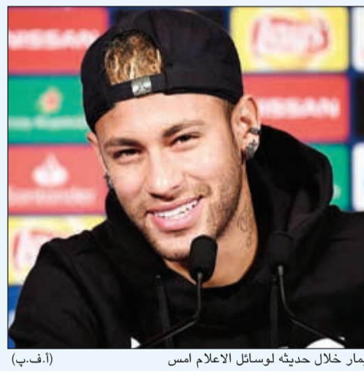
نيمار خلال حديثه لوسائل الاعلام امس (أ.ف.ب)

وعشية اللقاء ضد الفريق الصربي، تحدث نيمار عن علاقته بتوخل، الذي خلف الإسباني أوناي إيمري في تدريب الفريق، قائلا «صحيح أنه جاء بشيء جديد إلى باريس سان جرمان، منذ محادثتنا الأولى العام الماضي، أدركت أنه شخص قادر على النجاح، وهو يريد إظهار أفضل وجه له، أنا أعرف من هو، إنه يعرف تماما أين يريد الذهاب، إنها تجربة رائعة أن أعمل معه». وأمل أغلى لاعب في العالم في «أن يتمكن من نقلنا إلى أبعاد حد ممكن في دوري الأبطال، أنا شخصيا، أريد أن أظهر له ما يمكنني فعله».