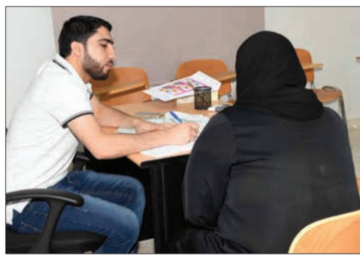
.. ويوفر 22 فصلا للتقوية

● لدينا خطط طموحة من أجل التطوير والتحديث دائما ووضعنا جدولا زمنيا نسير عليه، وهدفنا الفصل الدراسي الحالي تعزيز الثقة بين إدارة المعهد وأولياء الأمور، كما أننا نقوم بإرسال متابعات كل اسبوعين لولي الأمر حتى يكون على علم بوضع ابنه دراسيا ومدى تحصيله العلمي وتحديد نقاط القوة ونقاط الضعف، كما ان لدينا خطة طموحة لإنشاء مدرسة في المستقبل تعتمد على أسلوب تعليمي حديث ومبتكر.