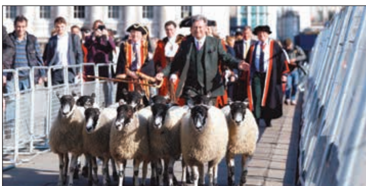
ألن تيتشمارش يقود قطع الخراف على جسر لندن

يمكن مشاهدة الفيديو يمكن استخدام QR كود أو