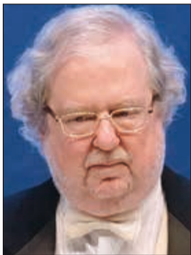
جيمس ب. اليسون

وفي الوقت عينه تقريبا، اكتشف هونجو بروتينية في الخلايا المناعية تعرف باسم «بي دي-1»، وأدرك بعد ذلك أنها أيضا تتمتع بقوة كابحة لكن بطريقة مختلفة.