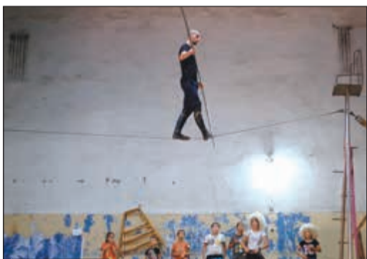
شاب يمارس هواية السير على الجبل

يمكن مشاهدة الفيديو يمكن استخدام QR كود أو