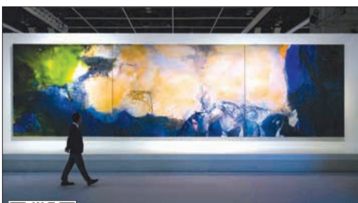
رجل يمر أمام لوحة «يونيو - أكتوبر 1985»

يمكن مشاهدة الفيديو يمكن استخدام QR كود أو