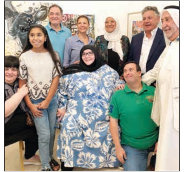
دمعومة المبارك وعدد من زوار المعرض