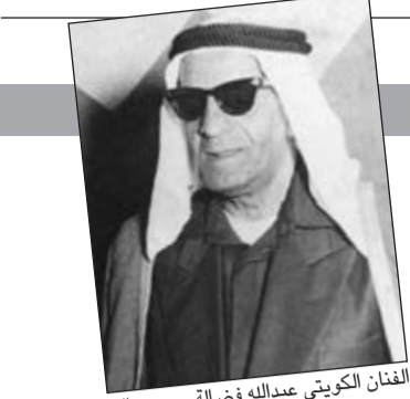
الفنان الكويتي عبدالله فضالة - رحمه الله