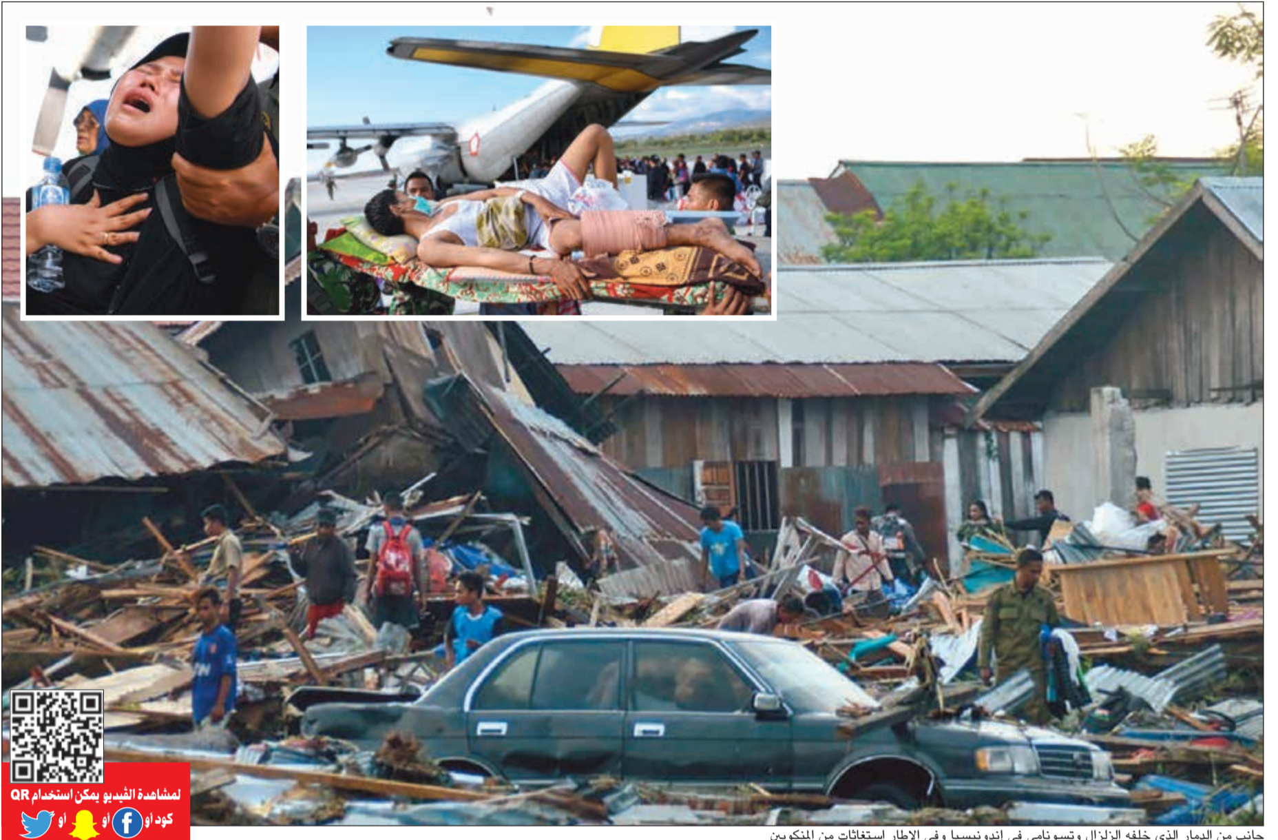
جانب من الدمار الذي خلفه الزلزال وتسونامي في إندونيسيا وفي الإطار استغايات من المتكويين