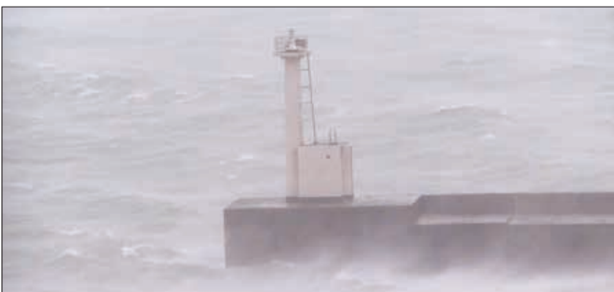
الإعصار ترامي تسبب في حصول اضطرابات كبيرة على صعيد شبكات النقل في غرب اليابان