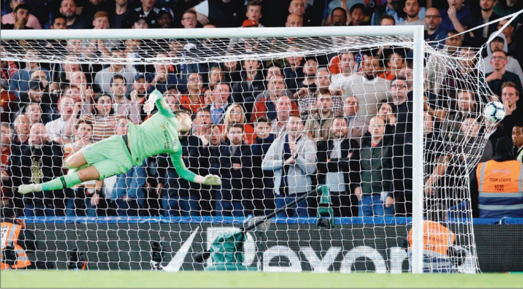
كرة ستوريدج الصاروخية تعانق شبك تشلسي