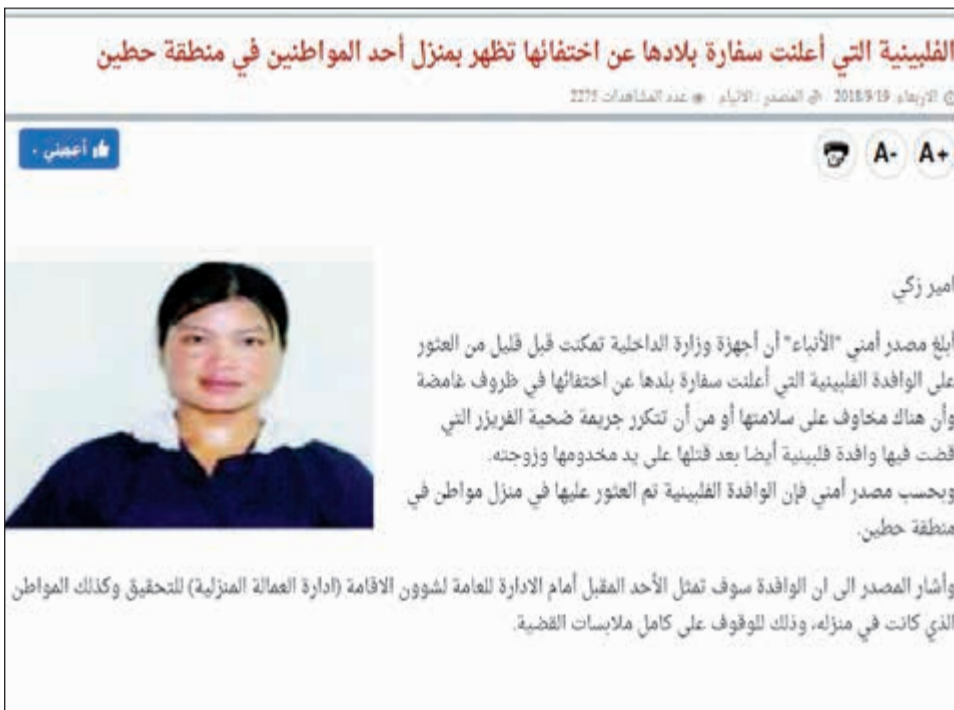
صورة عن الخبر الذي نشرته «الأنباء» في 19 الجاري على موقعها الإلكتروني