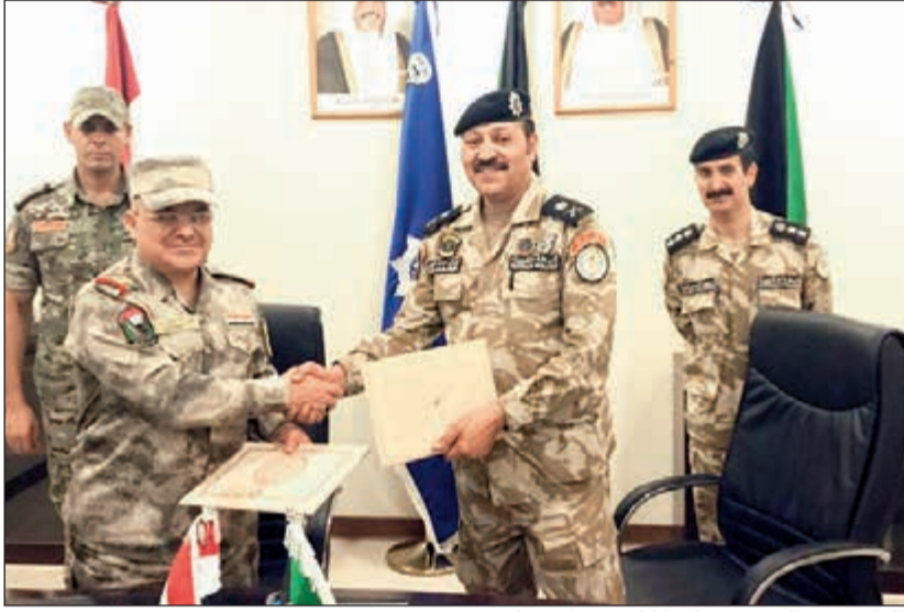
اللواء فيصل العيسى وسلام كاظم عقب الاجتماع

كما تمت مناقشة كيفية تبادل المعلومات وأهمية دور ضباط الاتصال بين الجانبين، كذلك تطرق الاجتماع إلى الزيارات المتبادلة ومناقشة الأوضاع الأمنية التي تهم الجانبين وخاصة فيما يتعلق بأمن الحدود. ويهدف الاجتماع إلى متابعة تنفيذ مقررات اللجنة الوزارية العليا المشتركة الكويتية - العراقية فيما يتعلق بأمن الحدود البرية بين البلدين إلى جانب تنمية التنسيق الثنائي وتعزيز إجراءات حماية ومراقبة الحدود من خلال السرعة في تبادل المعلومات المشتركة التي تساهم في ضمان أمن الحدود، وتطوير التعاون بين البلدين الشقيقين لمواجهة أي تحديات أو مستجدات خصوصا في ظل الظروف التي تشهدها المنطقة.