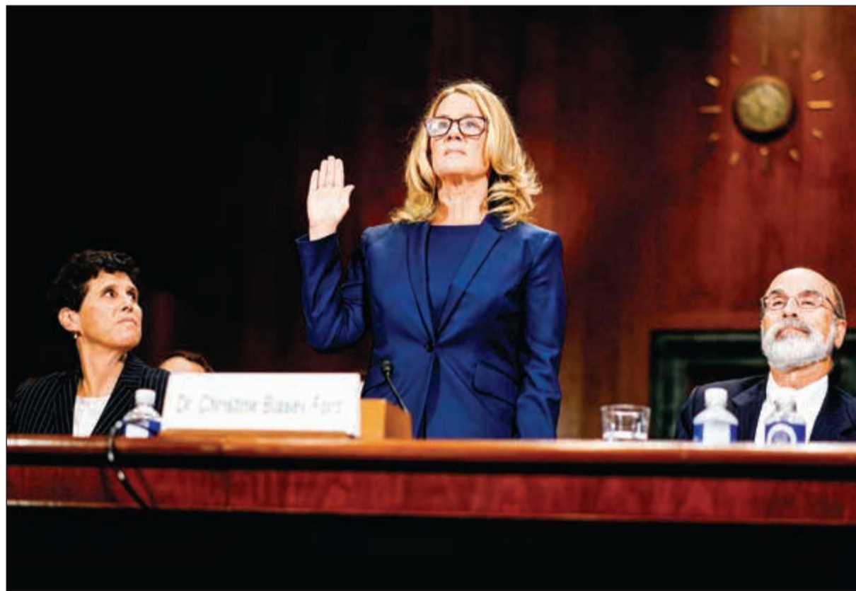
كريستن بلازي فوردي تؤدي اليمين قبل شهادتها ضد بريت كافانو أمام مجلس الشيوخ أمس

وقبل أسبوعين فقط بدأ كافانو وانقا من نيل موافقة مجلس الشيوخ المفترض أن يصوت اليوم على دخوله المحكمة العليا المنوطة بالتحقق من دستورية القوانين والتحكيم في مسائل اجتماعية مثل حق الإجهاض والأسلحة ووزاج المثليين. لكن شهادة بلازي هزت صورة كافانو كحافظ وزوج وأب، قبل أن تنضم إليها امرأتان خرجتا من الظل إحداهما ديورا راميريز التي كانت زميلته في الصف واتهمته بالتجاوز الجنسي خلال حفلة في جامعة ييل بعد ذلك بسنوات، والأخرى هي جولي سويتنيك البالغة 55 عاما، التي عملت لفترة طويلة مع الحكومة الفيدرالية واتهمته بدورها بأنه تصرف بشكل مسيء جنسيا عندما كانا مرافقين. وقالت إنه كان يدفع الفتيات إلى السكر حتى «يمكن اغتصابهن بصورة جماعية»، وقالت إنها تعرضت هي نفسها للتخدير والاعتصاب الجماعي خلال حفلة حضرها عام 1982، وأكدت أن كافانو وصديقه كانا حاضرين.