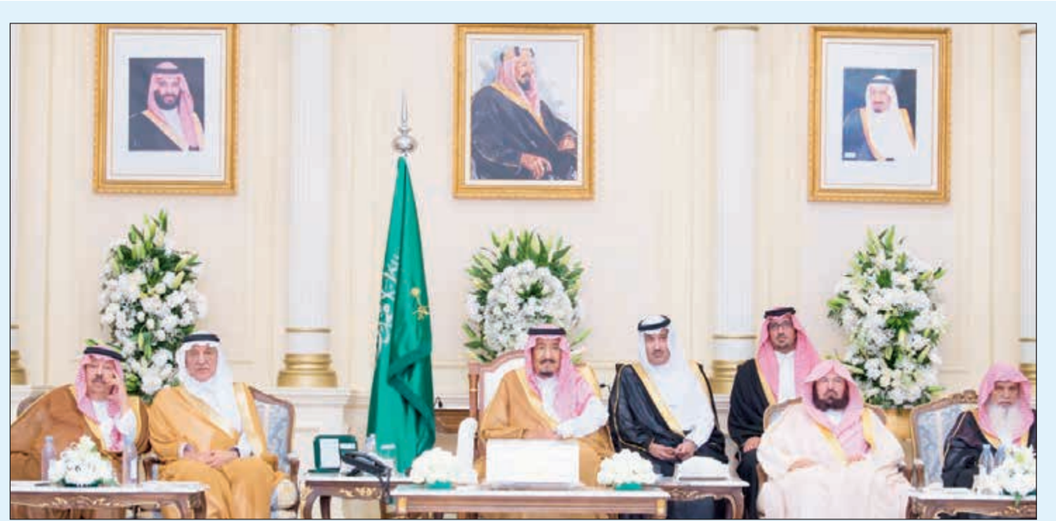
خادم الحرمين الشريفين الملك سلمان بن عبدالعزيز يشرف حفل استقبال أهالي منطقة المدينة المنورة ويدهن عددا من الشروعات في المنطقة

آخر الأخبار العربية والعالمية زوروا موقعنا على www.alanba.com.kw/International