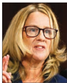
كريستين بلازي فورد

نفسه وفصلت الحادثة أمام لجنة العدل في الجلسة التي بثت على الهواء مباشرة. وحتى قبل بدء الشهادة أبدى ترامب انفتاحاً على سحب ترشيح كافانو وتعاظفاً مع بلازي نفسها، وقال «يمكنني دائماً أن أقتنع.. إذا وجدت أنه مشحوناً بالعواطف والدموع، وضعصع للغاية بالنسبة لامرأة، وليس هناك شك في ذلك».