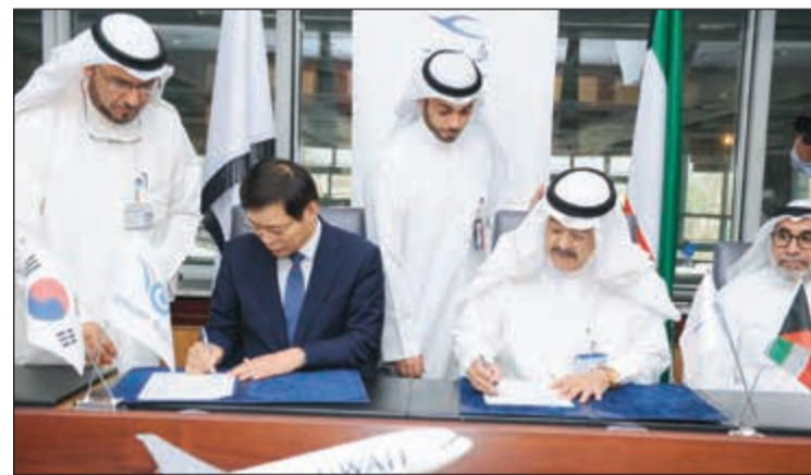
خلال توقيع العقد بين «الكويتية» و«إينشن» الكورية