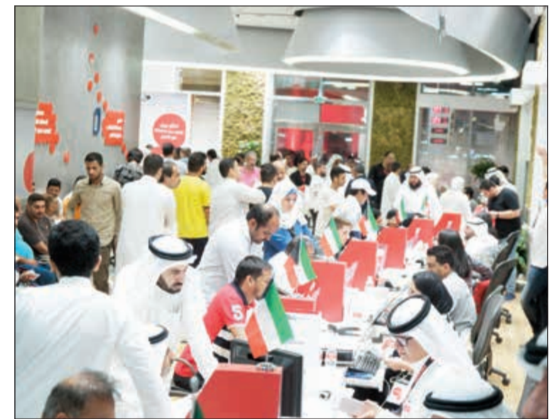
المبيعات ستستمر حتى ساعات الفجر

إضافة إلى ذلك، سيتمكن العملاء من شراء جهاز iPhone XR المصمم خصوصا لجعل مزايا أجهزة iPhone متوفرة بين أيدي أكبر شريحة ممكنة من الناس. يتميز الجهاز المصمم من الألمنيوم والزجاج بشاشة 6,1 إنشات مع تقنية Liquid Retina Display الأكثر دقة من حيث الألوان في عالم الهواتف الذكية، كما تتميز شاشة True Tone التي تساهم في تحسين الألوان لتكون أقرب إلى اللون الطبيعي. تم اعتماد شريحة Bionic A12 بتقنية الإلكترونيات الحيوية للتعرف على هوية مستخدم الجهاز بخاصية ID بشكل أسرع. يستطيع العملاء التقاط صور مميزة وجودة عالية بكاميرا الجهاز ذات العدسة الواحدة وذلك بفضل نظام الكاميرا المميز، ويعمل على شبكة LTE فائقة السرعة لسرعة تحميل إنترنت أكبر، يتوافر بستا ألوان.