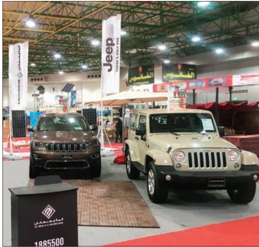
منصة عرض «جيب»

لاقى جناح الملا وبهبهاني، الموزع الوحيد لسيارات ألفا روميو، أبارث، كرايسلر، دودج، فيات، جيب، رام، بروفيشيونال، جيب، رام، موبار في الكويت اقبالا كبيرا من الزوار الذين حرصوا على التعرف على موديلات جيب التي تم عرضها والاستفادة من العروض الحصرية خلال فترة العرض وذلك في معرض «الرياضات البرية والبحرية 2018» والذي تم تنظيمه على ارض المعارض بمشرف في الفترة من 18 الى 22 الجاري.