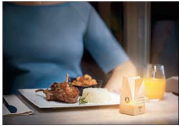
تفاصيل وجبات الطعام وصور الأطباق الرئيسية متوفرة عبر موقع «التركية»