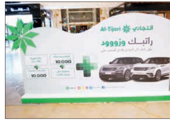
جناح «التجاري» في «ذا جيت مول»

وعن آلية الانضمام إلى هذه الحملة والاستفادة من المزايا التي توفرها، أوضح فريق التسويق والمبيعات لرواد الجناح في ذا جيت مول أنه باستطاعة أي موظف راتبه يفوق 500 دينار سواء تم تعيينه حديثا أو في الخدمة الفعلية منذ سنيين القيام بتحويل راتبه إلى البنك والاستفادة من مزايا هذه الحملة التي تم تصميمها خصوصا بصورة تناسب الموظفين الكويتيين العاملين في القطاع الحكومي والنفطي والشركات الخاصة المدرجة في القائمة الخاصة بالمرحلة الأولى من الجناح. كما يمكن للموظفين الاستفادة من مزايا هذه الحملة التي تم تصميمها خصوصا بصورة تناسب الموظفين الكويتيين العاملين في القطاع الحكومي والنفطي والشركات الخاصة المدرجة لدى البنك، كونها توفر لهم أيضا فرصة الحصول على العديد من المميزات الإضافية والتمتع بالعديد من الخدمات المتطورة والمنتجات الفريدة والمميزة التي يوفرها التجاري لعملائه لتلبي احتياجاتهم وترتقي لمستوى تطلعاتهم.