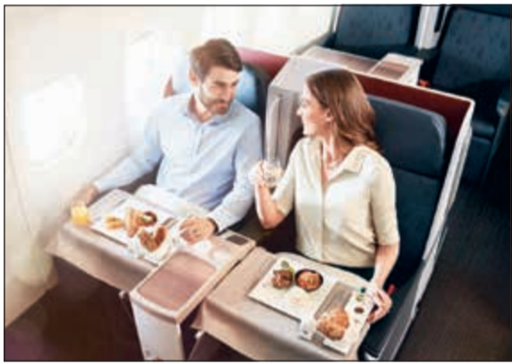
درجة رجال الأعمال على متن «التركية»

وتابعه، وطوكيو، وتورنتو، وواشنطن، وكاراكاس، وبينما سيأتي، ومدغشقر، وديربان، ومابوتو، وبوينس آيرس. خدمة «تناول الطعام عند الطلب»: تجربة جديدة أخرى تضيفها «التركية» إلى قائمة خدماتها المميزة المقدمة إلى ركاب درجة رجال الأعمال على متن رحلاتها العابرة للقارات، حيث يتيح هذه الخدمة للركاب تناول طعامهم في أي وقت يريدونه خلال الرحلة. ويسمح هذا المفهوم للركاب بالحصول على خدمة مخصصة حسب طلبهم. وبذلك، سيحظى مسافرو «التركية» برحلة أكثر مرونة حيث يمكنهم تحديد الوقت الذي يرغبون أن يستريحوا فيه أو يتناولوا طعامهم.