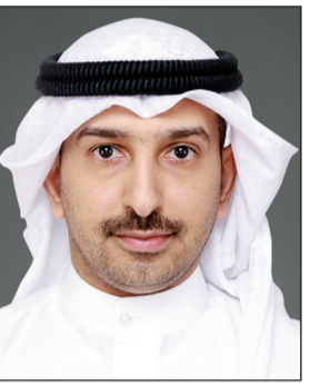
عبد الوهاب الباطين

تقدم النائب عبد الوهاب الباطين باقتراح برغبة طالب فيه بإنشاء حارة خاصة للاستدارة الواقعة في شارع دمشق الفاصل بين منطقتي الروضة والعديلية.