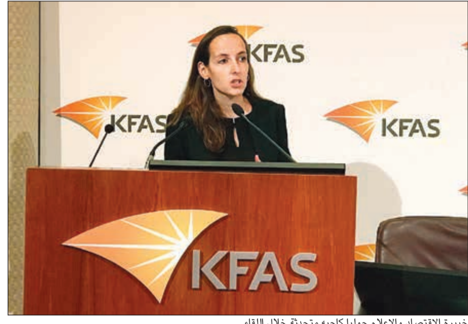
خبيرة الاقتصاد والإعلام جوليا كاجيه متحدة خلال اللقاء

فإن نشرها اليوم يتم بعد دقائق بما يقلل قدرتها على الاستفادة منها ماليا، ومع تراجع التمويل تضطر الصحف لتصغير فرق عملها فتنتج معلومات أقل جودة وهذا خطير، لأننا نصبح في عالم نتجحه المعلومات من كل صوب، لكن العالي الجودة