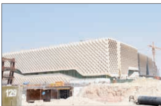
مبنى كلية التربية

تتقسم مشاريع مدينة صباح السالم الجامعية الى قسمين اولهما مباني الكليات والمرافق وثانيهما مشاريع البنية التحتية، ونظرا لتنوع اعمال البنية التحتية اتخذت جامعة الكويت قرارا بتقسيم تلك الاعمال الى حزم وتشمل تلك الاعمال اعمال الحفر وتسوية الأرض والطرق ومواقف السيارات والملاحي ومحطات الخدمات المركزية والانفاق السالم الجامعية شبكة أنفاق عملاقة بمساحة تبلغ 7,5 كيلومترات تجعلها الشبكة الأكبر على مستوى الشرق الأوسط حيث يبلغ عرض وارتفاع النفق 8 امتار مما يسمح بتحرك سيارات الخدمات داخل النفق لتقديم خدمات الصيانة المختلفة كما يحتوي المشروع على 26 ملجا طوارئ حديث تم تصميمها وتنفيذها وفق أحدث المعايير العالمية لحماية الأفراد ضد مختلف الأخطار واعتمدت مباني مدينة صباح السالم الجامعية على أساليب التبريد بالمياه بواسطة محطات الخدمات المركزية في تبريد الحرم الجامعي.