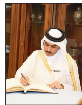
كلمة في سجل التعازي

الإيراني من قبل اراهين، أجاب: ليس من الصعب أن يجد الإرهابيون طريقه ما للهجوم وحصل في الكثير من الدول في السابق وتأمل ألا يحصل هذا في أي مكان بالعالم. وبخصوص تهديدات مستشار الأمن القومي الأميركي جون بولتون بأن إيران ستدفع ثمنها باهظا، قال إن الالهجة التصعيدية والعدائية ضد إيران تأتي من وراء المحيط الاطلنطي وليس من أطراف أخرى في المنطقة، وهذه الهجة العدائية لا تخدم الإقليم بل ستشكل ضغطا عليه وهي لا تخترل بإيران فقط إنما الإقليم كله لخط الأوراق والاستقرار. وأضاف: الإقليم يحتاج إلى الهدوء والتكاتف للانتصار على هذه التحديات، وأتمنى أن يدعونا وشأننا في هذا الإقليم. وفي رده على الصيغة القانونية الأوروبية الجديدة للخروج من العقوبات الأميركية المفروضة على إيران، أجاب: نحن نرحب بكل العمل الذي يؤدي إلى الوفاق والسلم والازدهار في المنطقة.