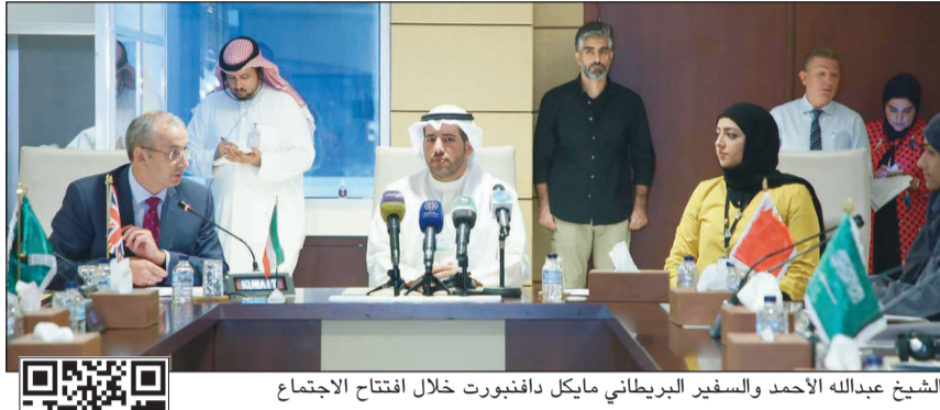
الشيخ عبدالله الاحمد والسفير البريطاني مايكل دافنبورت خلال افتتاح الاجتماع

وقال دافنبورت إن المملكة المتحدة دولة بحرية ولها ارتباط تاريخي وثقافي مع البحر كدول مجلس التعاون وتدرك تماما أهمية البحر في التنمية الاجتماعية والاقتصادية والعمل وفق هذا الأمر. من جهته قال ممثل الأمانة العامة لدول المجلس المستشار عادل بستكي إن هناك عدة مقترحات وضعتها المملكة المتحدة وتلخص بالبحث بالمؤشرات البيئية الخاصة بجودة المياه وشبكة مراقبة نوعية المياه وإدارة المناطق البحرية المحمية وتقسيمها، والنظر في الأنواع الغريبة الغازية للمياه.