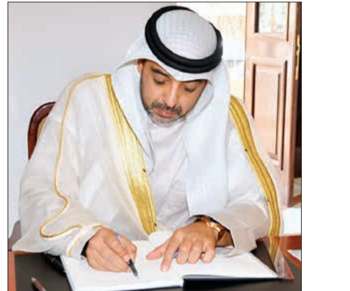
الشيخ محمد عبدالله يسجل كلمة في سجل التعازي

قام نائب وزير شؤون الديوان الأميري الشيخ محمد عبدالله صباح أمس بزيارة إلى سفارة جمهورية فيتنام الاشتراكية لدى الكويت حيث نقل تعازي صاحب السمو الأمير الشيخ صباح الأحمد وسمو ولي العهد الشيخ نواف الأحمد وسمو رئيس مجلس الوزراء الشيخ جابر المبارك وحكومة وشعب الكويت وذلك بوفاة الرئيس تران داي كوانغ رئيس جمهورية فيتنام الاشتراكية.