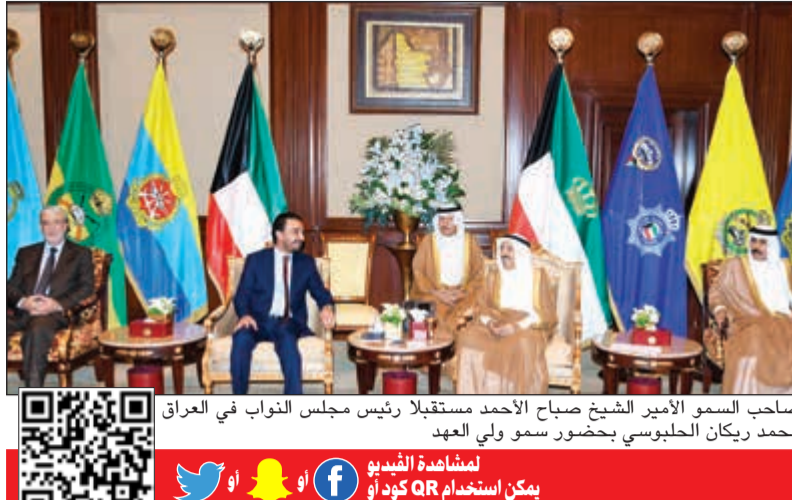
صاحب السمو الأمير الشيخ صباح الأحمد مستقبلاً رئيس مجلس النواب في العراق محمد ريكان الحلبي بحضور سمو ولي العهد لمشاهدة الفيديو يكن استخدام QR كود أو