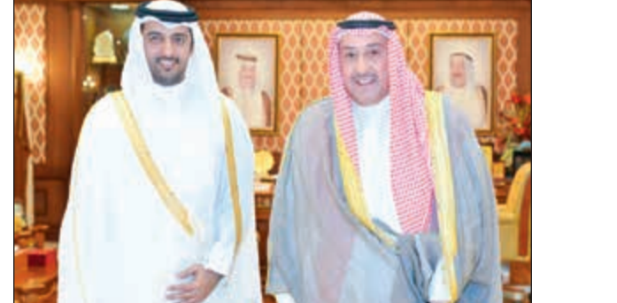
الشيخ فيصل الحمود مستقبلاً السفير القطري بندر بن محمد العطية

استقبل محافظ الفروانية الشيخ فيصل الحمود بمكتبه، سفير دولة قطر الشقيقة بندر بن محمد العطية بمناسبة تسلم مهام عمله. وتبادل الطرفان الأحاديث الودية التي تناولت العلاقات الثنائية التي تربط بين البلدين والشعبين الشقيقين، وتطرقا إلى فرص تعزيز التعاون وتبادل الخبرات المشتركة. وأكد الشيخ فيصل الحمود، عمق العلاقات الكويتية - القطرية في شتى المجالات منذ زمن طويل، معرباً عن تمنياته للسفير الجديد بالتوفيق والنجاح في دفع علاقات الصداقة بين البلدين إلى آفاق أوسع وأرحب. من جانبه، أعرب السفير العطية عن امتنانه للرعاية التي حظي بها على الصعيدين الرسمي والشعبي في الكويت منذ مباشرة مهامه. من جانب آخر، استقبل الشيخ فيصل الحمود مندبل بن جدعان السويط من المملكة العربية السعودية الشقيقة، حيث رحب المحافظ بضيافته في بلده الثاني الكويت بين أهله وإخوانه.