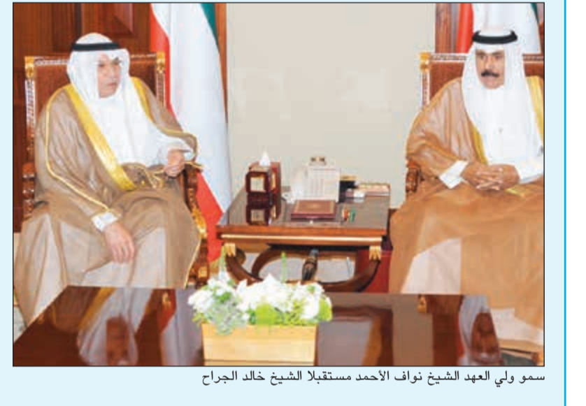
سمو ولي العهد الشيخ نواف الأحمد مستقبلاً الشيخ خالد الجراح

استقبل سمو ولي العهد الشيخ نواف الأحمد بقصر بيان صباح أمس رئيس مجلس الوزراء بالإنيابة ووزير الداخلية الشيخ خالد الجراح.