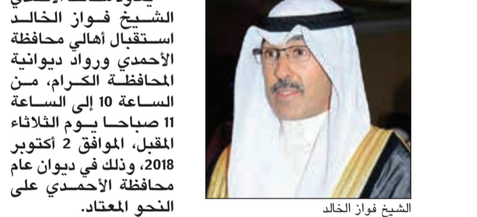
الشيخ فواز الخالد