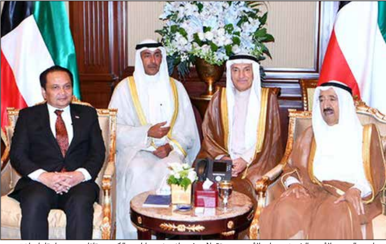
صاحب السمو الأمير الشيخ صباح الأحمد مستقبلاً سفير أندونيسيا لدى الكويت تاجا بوي اوتاما رازق