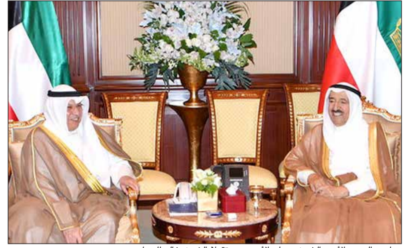
صاحب السمو الأمير الشيخ صباح الأحمد مستقبلاً الشيخ خالد الجراح