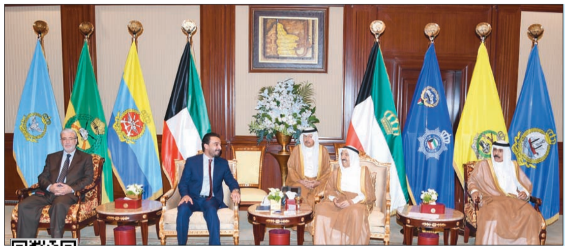
صاحب السمو الأمير الشيخ صباح الأحمد مستقبلاً رئيس مجلس النواب في العراق محمد ريكان الحلبي بحضور سمو ولي العهد

حددت وزارة التربية اليوم الخميس آخر موعد لإجراءات النقل للهيئة التعليمية بين المدارس. جاء ذلك خلال اجتماع مديري المناطق التعليمية الذي عقد صباح أمس برئاسة وكالة التعليم العام فاطمة الكندري تم خلاله التطرق إلى ضرورة تسهيل إجراءات تسجيل الطلبة «البنون» أبناء وأحفاد العسكريين في مناطق سكنهم حسب النشرة الأخيرة بهذا الخصوص.