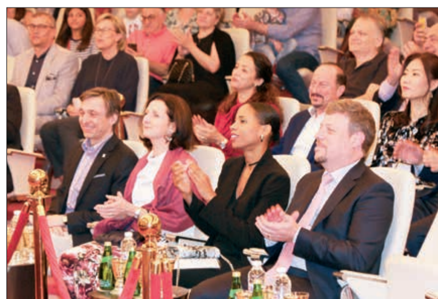
السفير البلجيكي في مقدمة الحضور

وقد تالق فندق كراون بلازا «الغريا سيتي» كعادته في تقديم فعالية مبهرة بخدمة عالية الجودة.