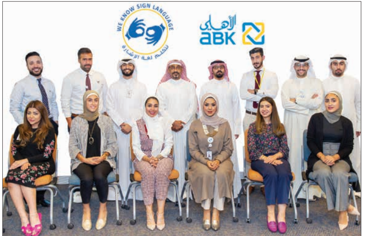
موظفو البنك الأهلي خلال الدورة التدريبية

كتب عليها عبارة «نكتلم لغة الإشارة». وتأتي هذه الخدمة في إطار التزام البنك الأهلي الكويتي بتقديم خدمات مصرفية متكاملة لجميع فئات المجتمع لتلبية احتياجاتهم المصرفية المختلفة.