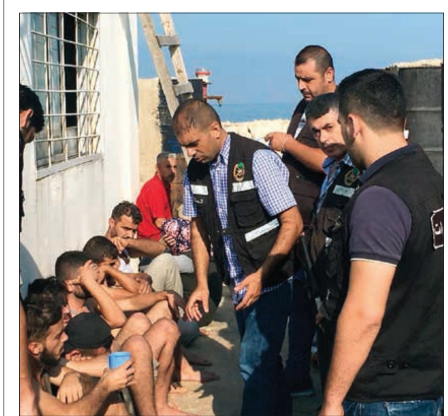
عدد من اللاجئين الذين تم انقاذهم قبالة سواحل لبنان (محمود الطويل)